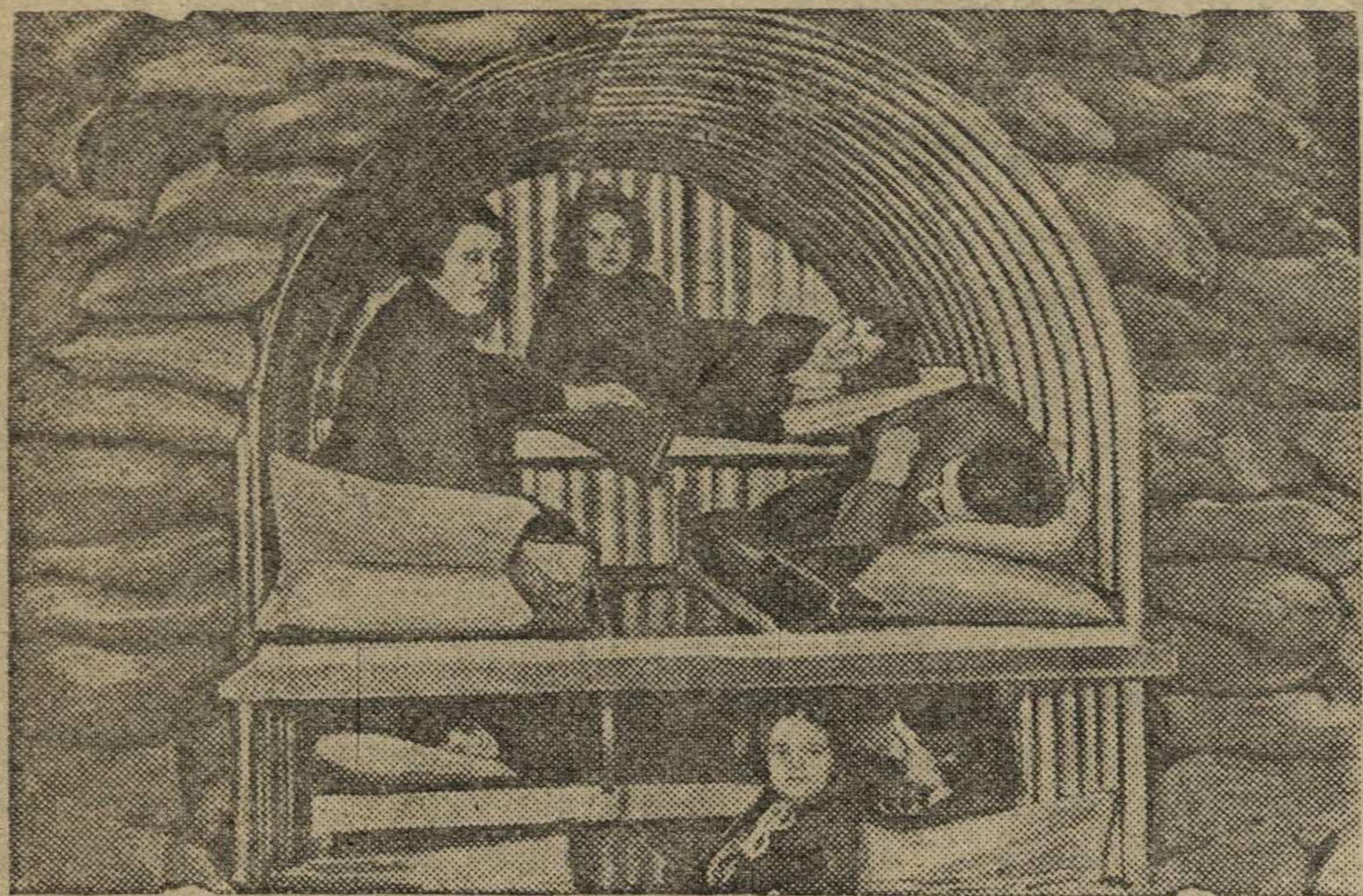
НА СНИМКЕ: Внутренний вид бомбоубежища Андерсона в Англии.