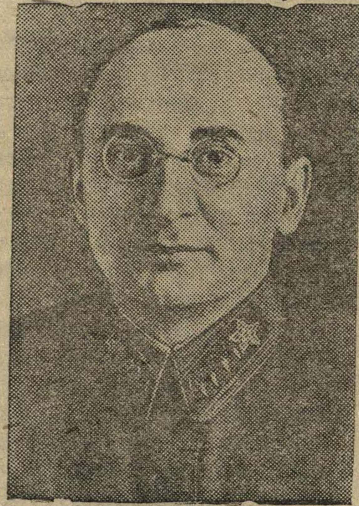
На снимке: тов. Л. П. Берия.

Кинофильм «Суворов» пользуется большим успехом у ленинградских зрителей. Кинотеатры, в которых демонстрируется эта картина, переполнены. Копировальная фабрика им. 1 мая отпечатала 200 экземпляров фильма «Суворов». В ближайшее время будет отпечатано еще свыше 300 экземпляров. На днях несколько копий фильма будет отправлено в Таллин, Каунас и Ригу.