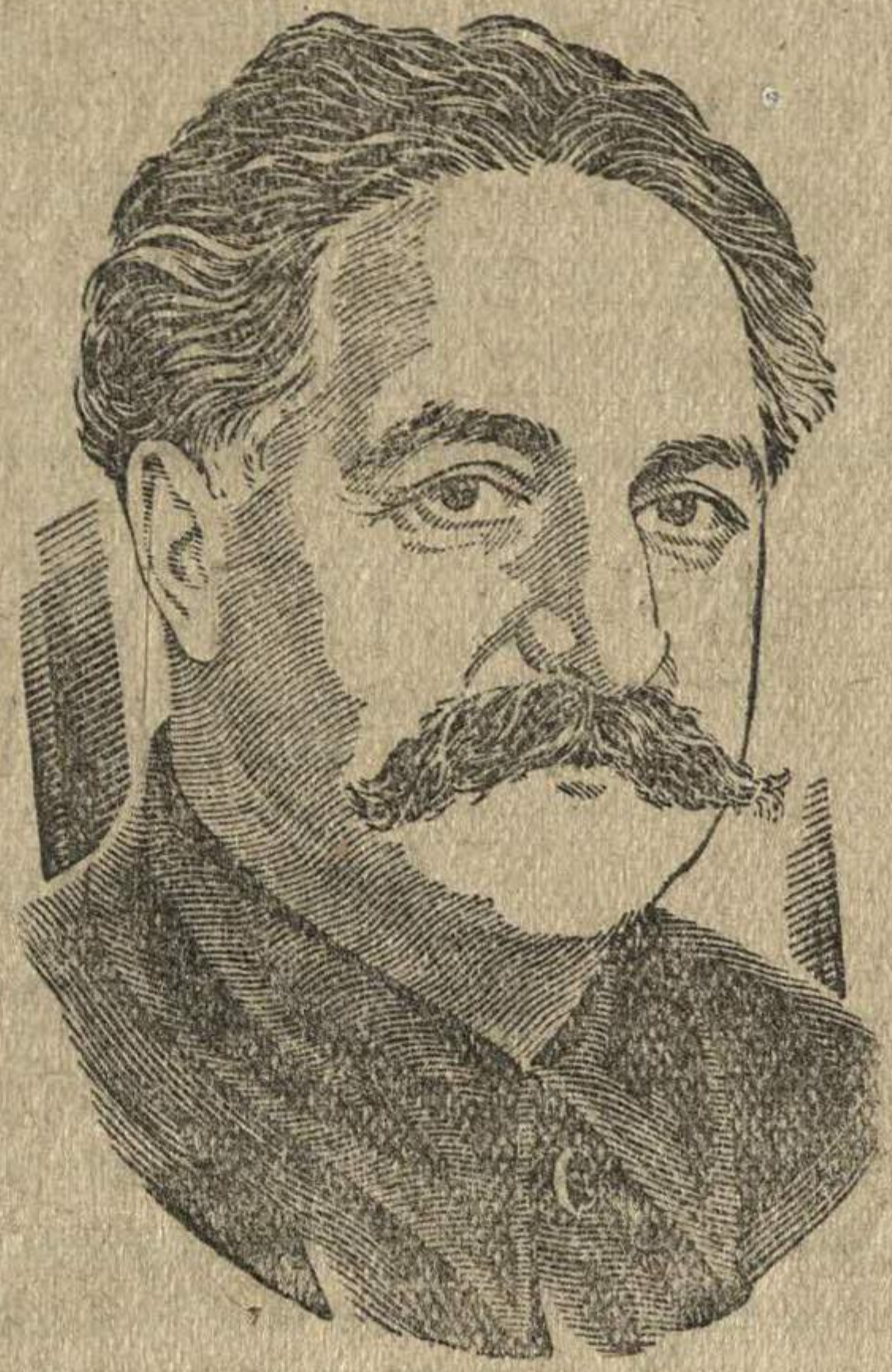
На снимке: Г. К. Орджоникидзе.

ромным хозяйством и вести его к победе, нужно было обладать широким политическим кругозором, обширными знаниями, железной настойчивостью и решительностью, неутомимой энергией. Всеми этими качествами Серго обладал в полной мере. Это был руководитель ленинско-сталинского стиля, соединивший в своей работе большевистский революционный размах с американской деловитостью.