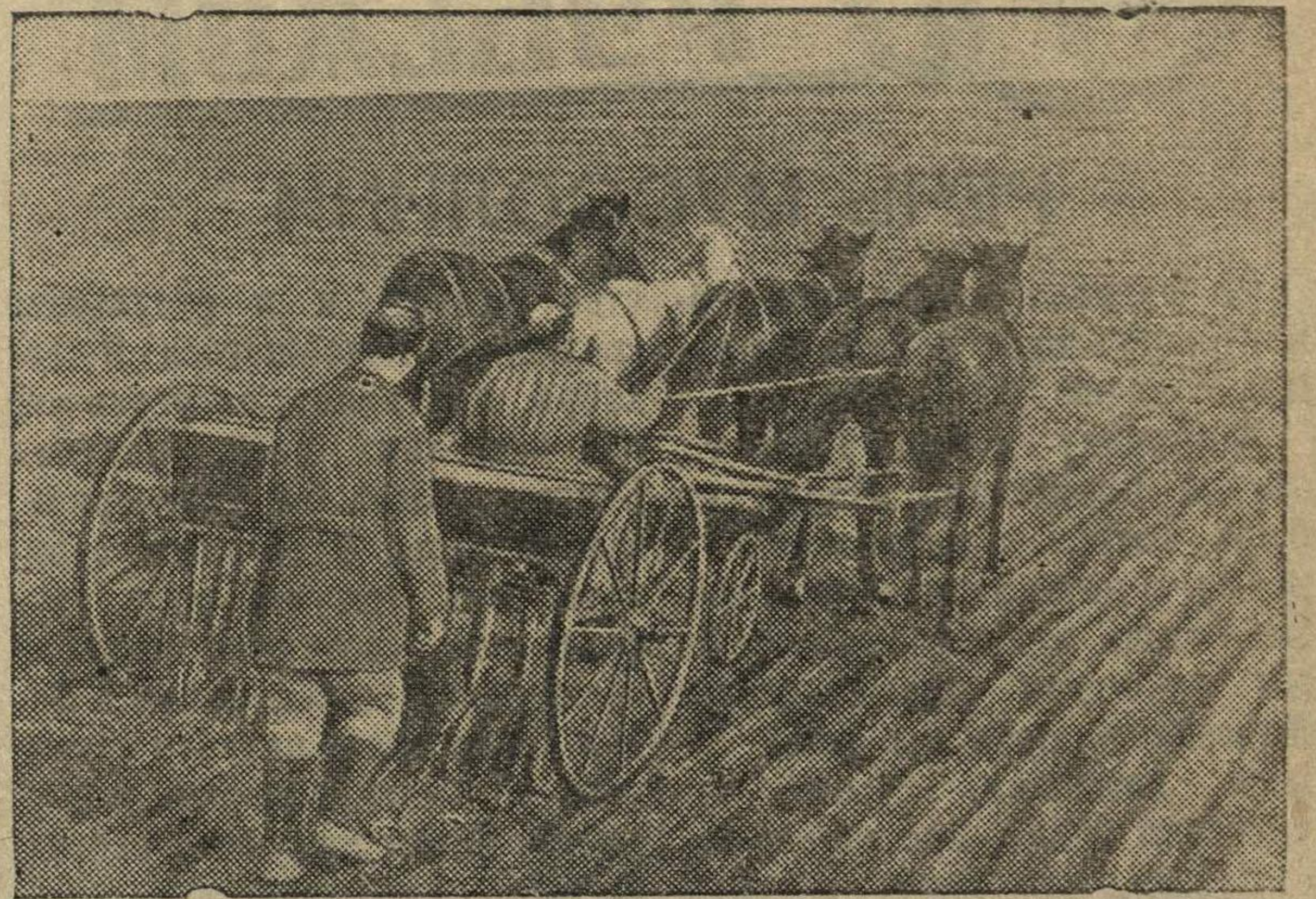
Сев ячменя конной саялкой по культивированной зяби в колхозе «12-ый Октябрь» (Симферопольский район).

В Крыму установилась теплая солнечная погода. Некоторые колхозы приступили к весенним полевым работам.