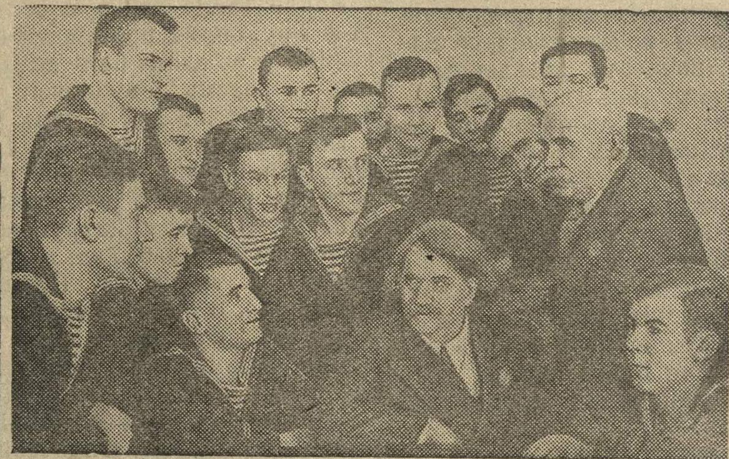
На снимке: писатели-орденоносцы С. Н. Сергеев-Ценский и А. С. Новиков-Прибой среди курсантов Высшего военно-морского ордена Ленина Краснознаменного училища имени М. В. Фрунзе (Ленинград).

Когда после последнего штурма защитники Севастополя оставили свои бастионы и редуты и перешли на Северную сторону города, они не были побеждены. Победена была царская Россия Николая Палкина, Россия крепостного права, вундта, невежества, отсталости,