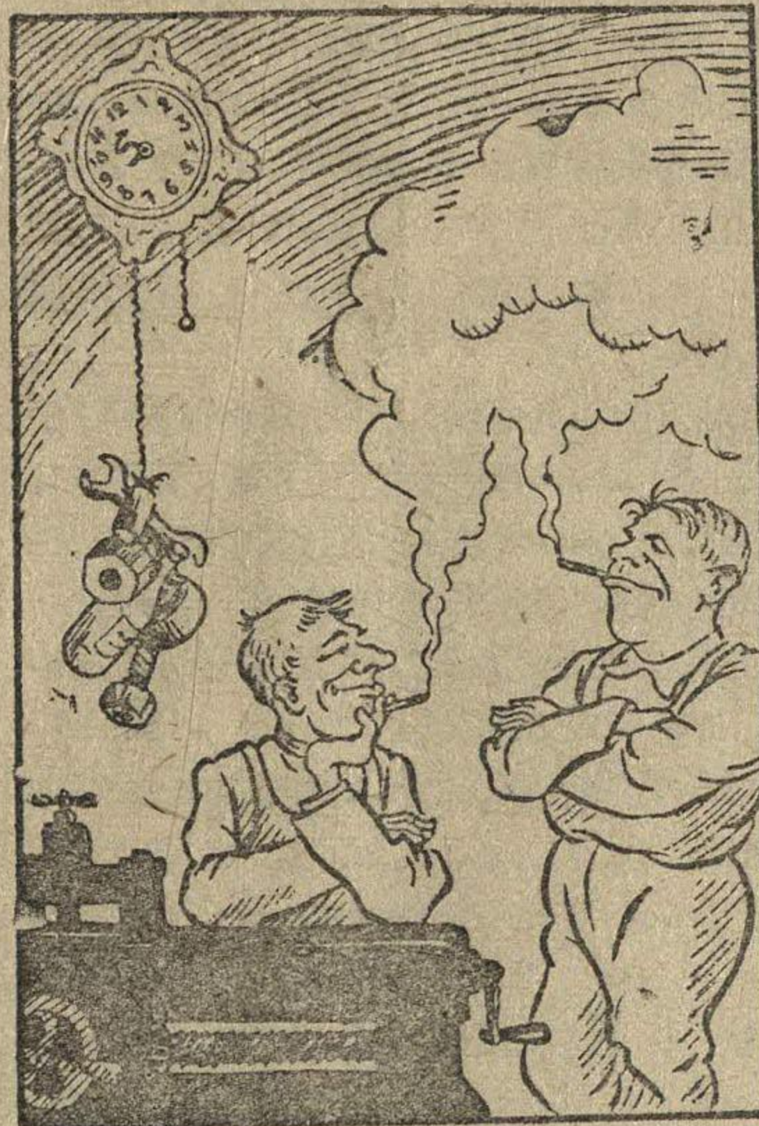
Работают, как часы... Рисунок В. Лисевича.