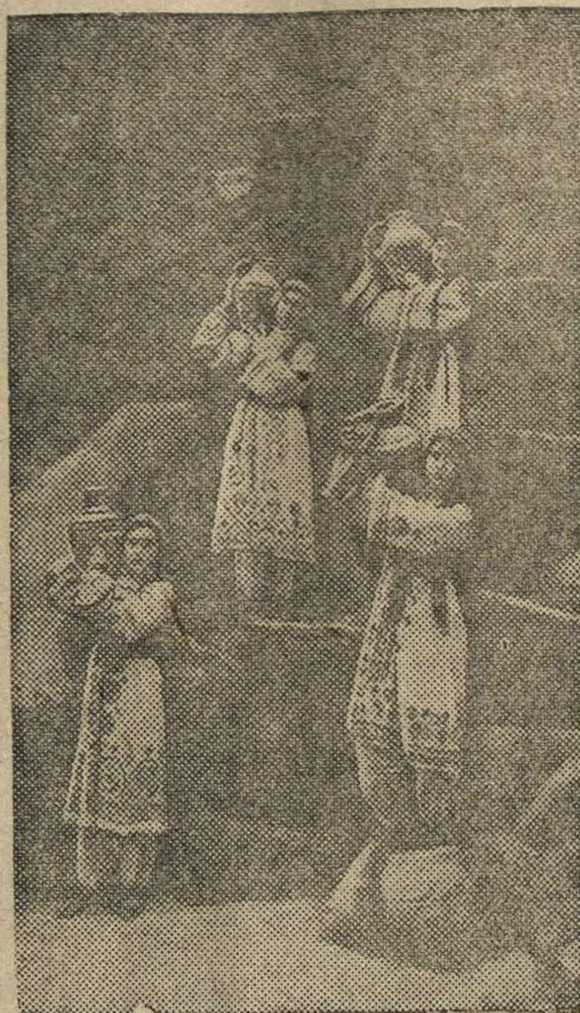
Сцена из 1-го акта музыкального представления «Лола» в постановке Таджикского Государственного театра оперы и балета (Сталинабад).

Подготовка к декаде таджикского искусства в Москве.