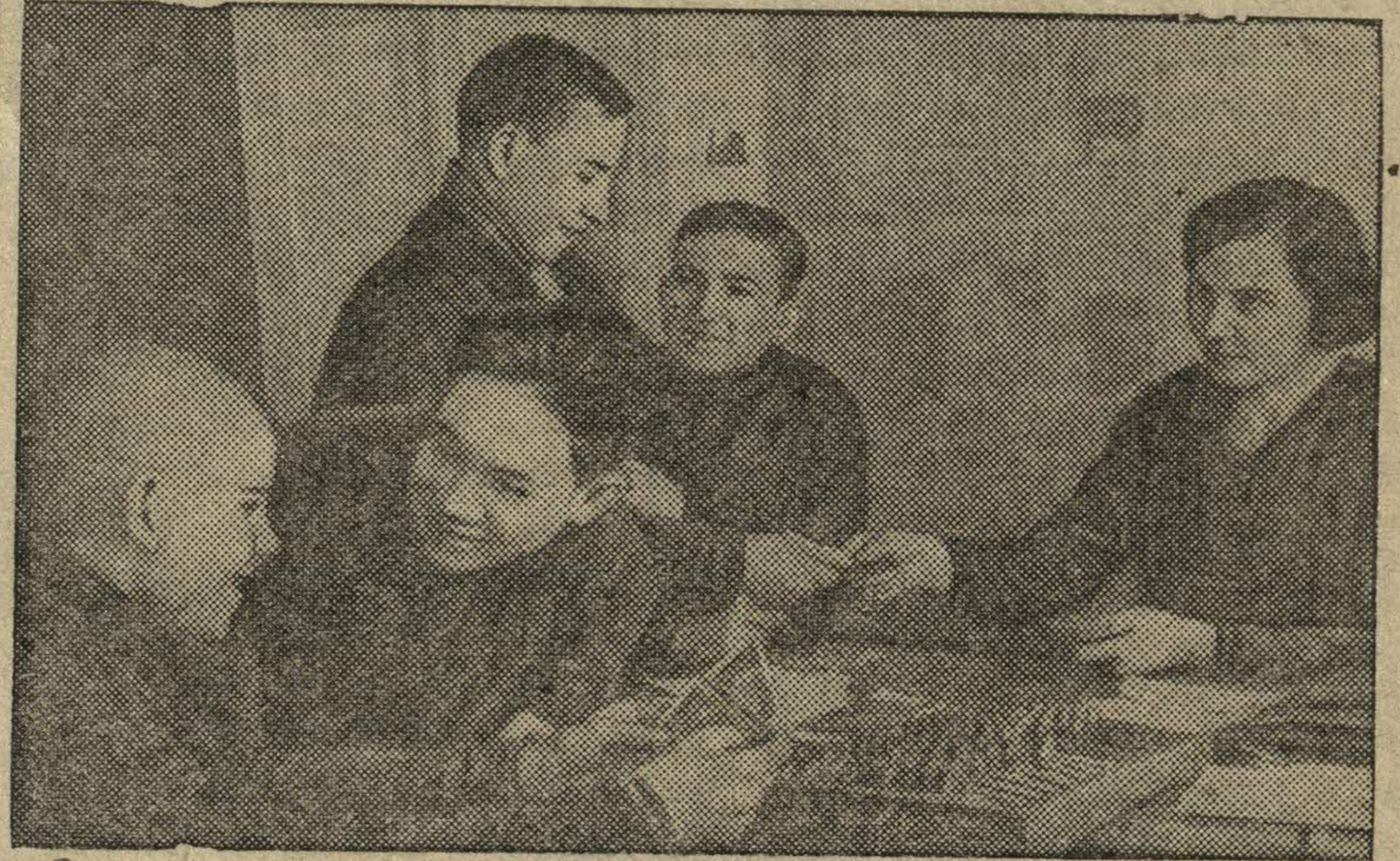
Ученики школы получают заработок.

В школе ФЗО № 1 при тресте «Строитель» (Москва).