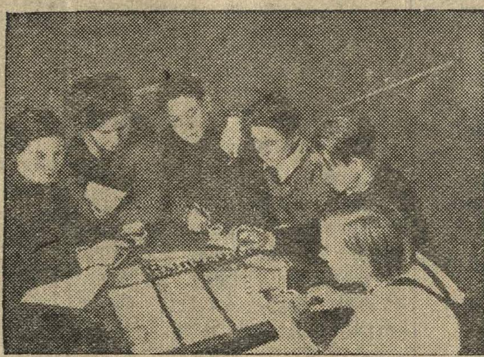
НА СНИМКЕ: Редколлегия стенгазеты «Выпускник», X класса средней школы имени М. Горького, за выпуском очередного номера.