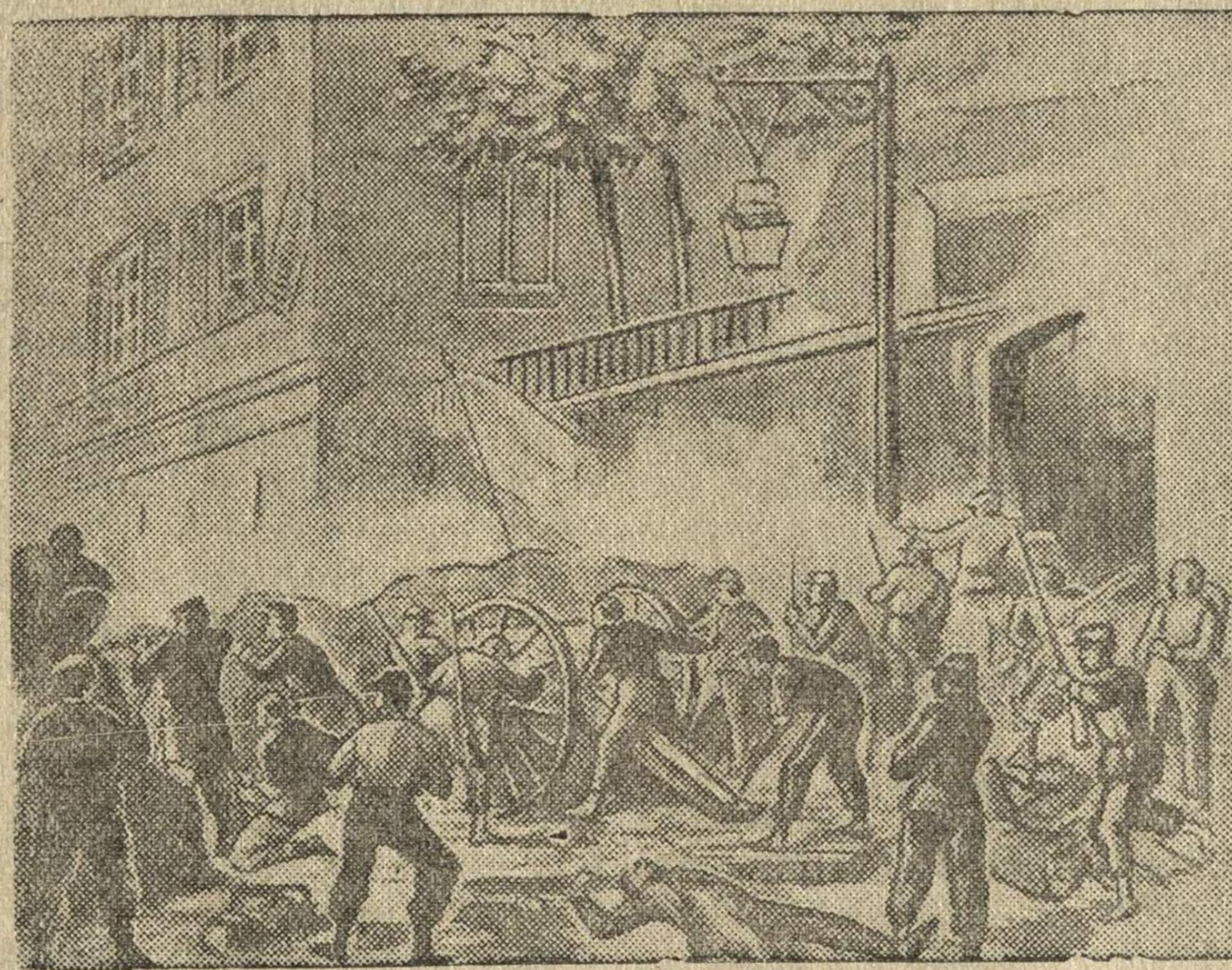
Уличные бои в Париже.

По приказу Коммуны была разрушена знаменитая Вандомская колонна, воздвигнутая в честь побед Наполеона I. Актом разрушения этой колонны коммунары демонстрировали перед всем миром свою верность идеям интернационализма.