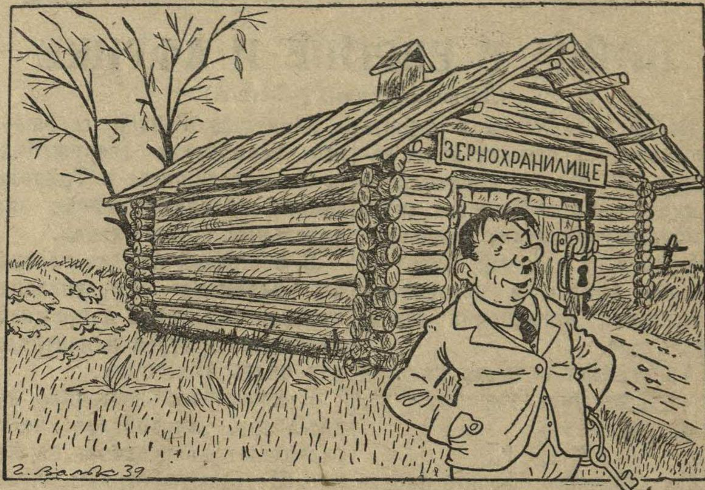
ГОРЕ-РУКОВОДИТЕЛЬ:—Главное сделано: урожай убран и хорошо охраняется...