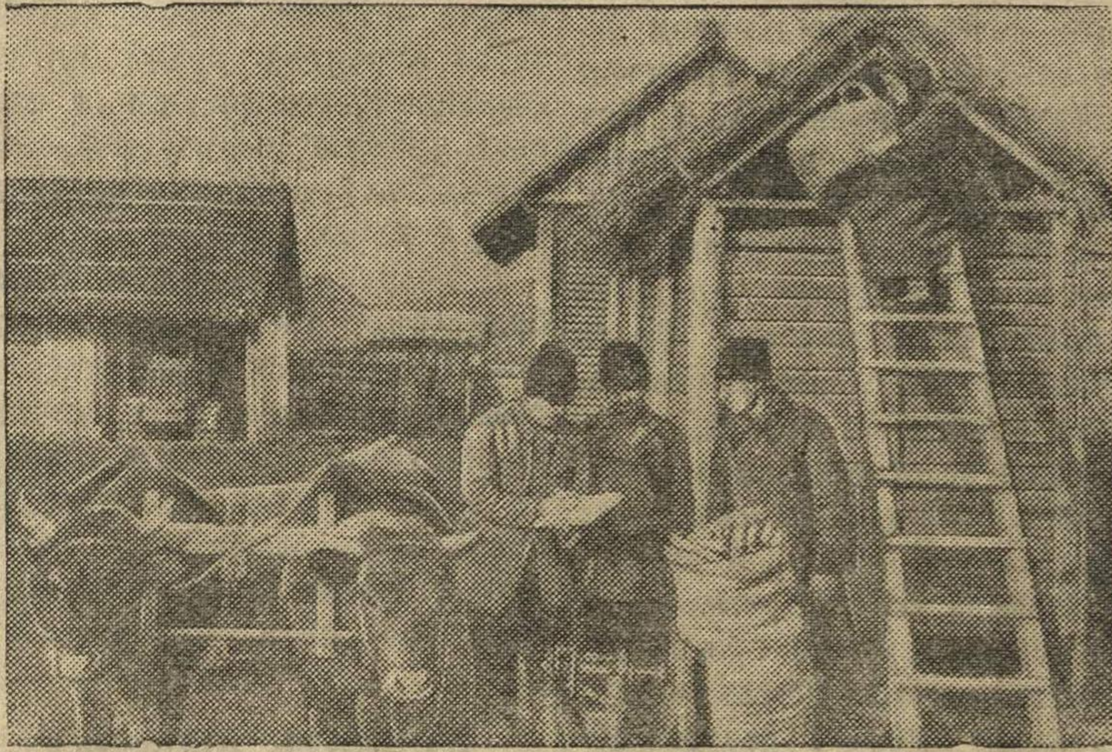
Колхозники колхоза им. Котовского привезли посевной материал.

В Бендерском уезде (Молдавская ССР) в этом году создано два новых колхоза. Колхозники деятельно готовятся к первой большевистской весне.