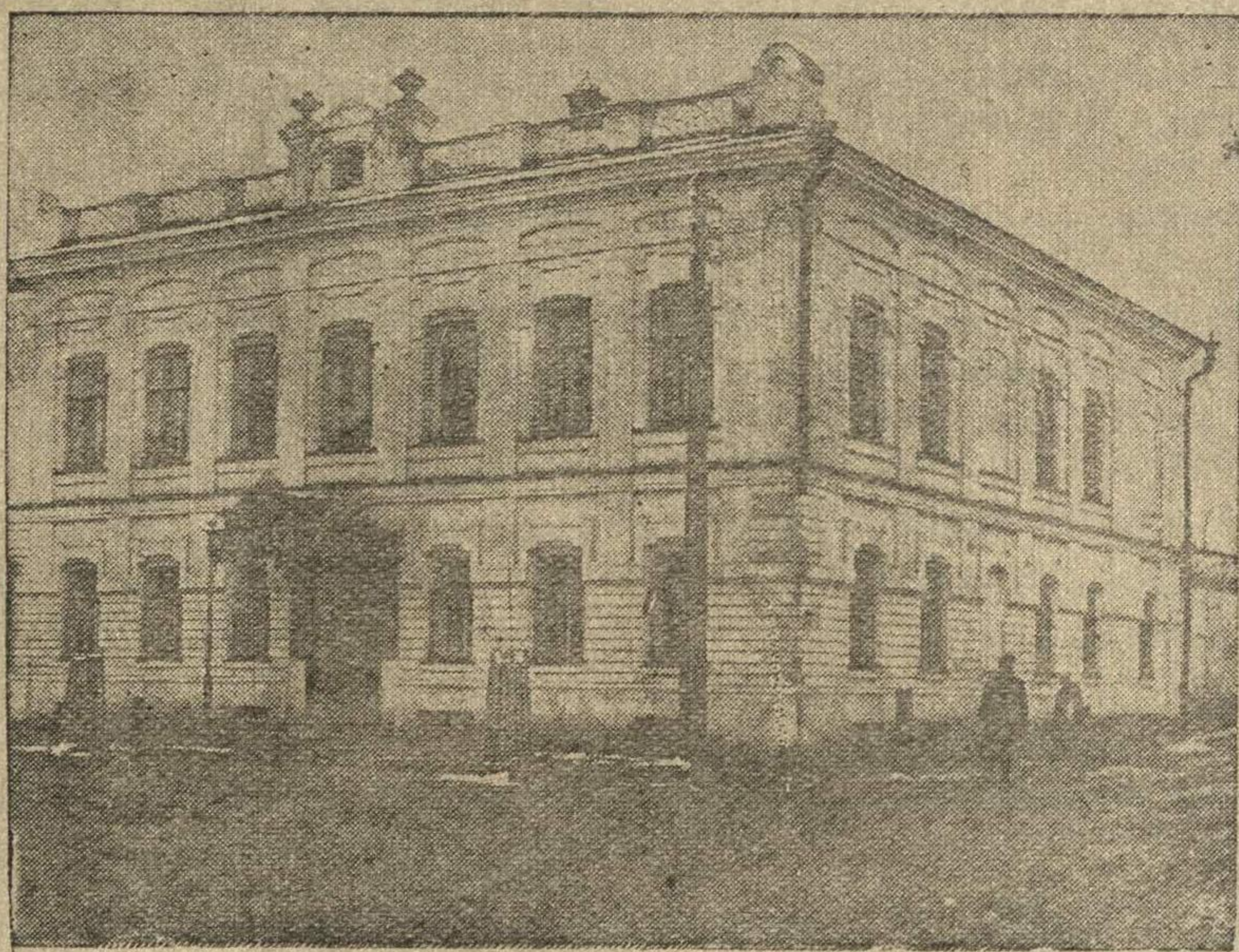
НА СНИМКЕ: ЗДАНИЕ ГОРОДЕЦКОГО МУЗЕЯ.

Сверх программы кино-журнал Начало сеансов в 8 часов и 10 часов вечера. Касса с 6 часов вечера. Администрация.