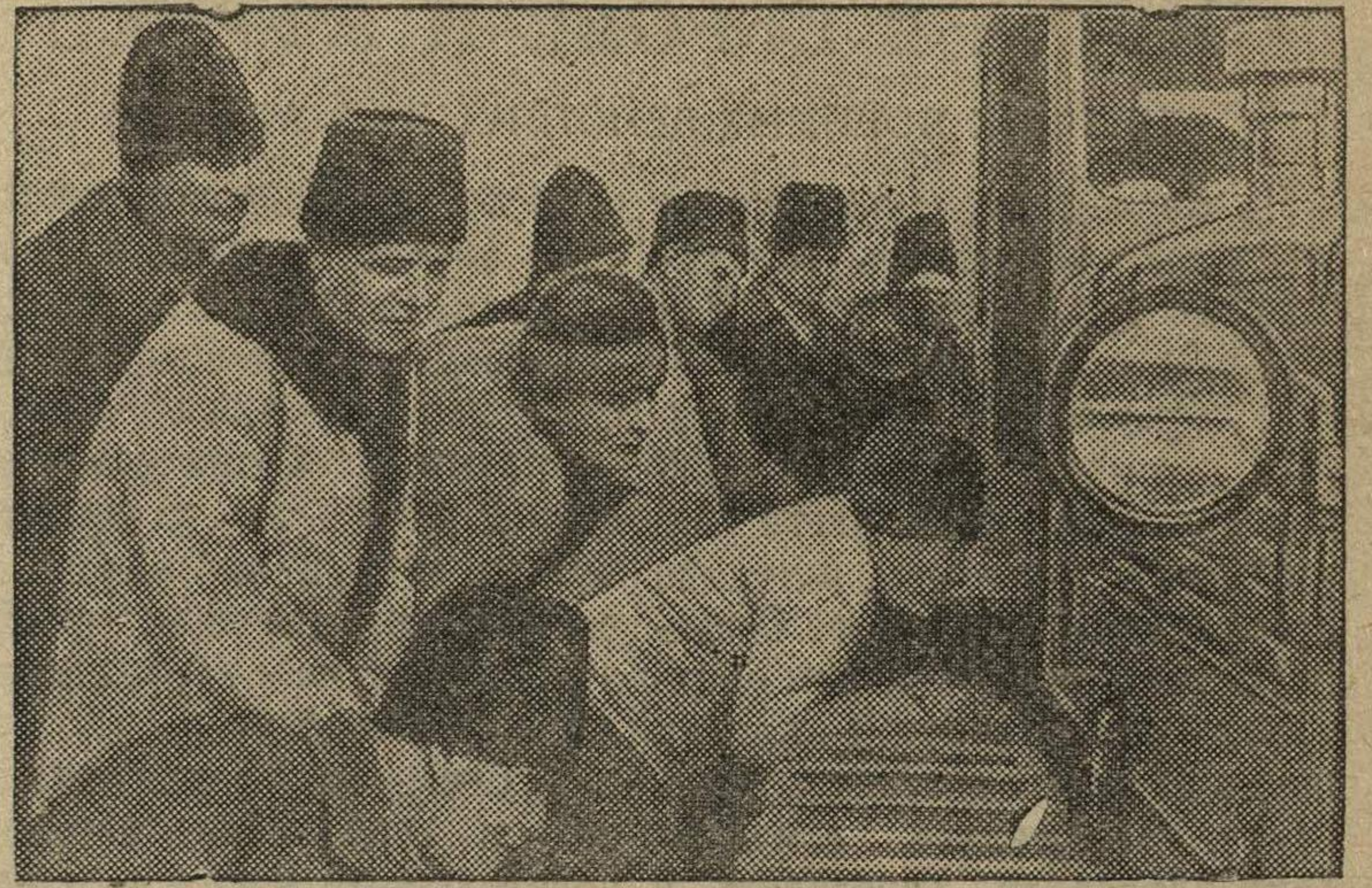
На снимке: Колхозники недавно организованного колхоза «Новая жизнь» (село Кыцканы, Бендерский уезд) осматривают первый трактор, прибывший для обслуживания весенне-посевной кампании.

Каждый день в Молдавскую ССР прибывают десятки новых тракторов, которые прямо со станции отправляются во вновь организованные МТС и колхозы республики.