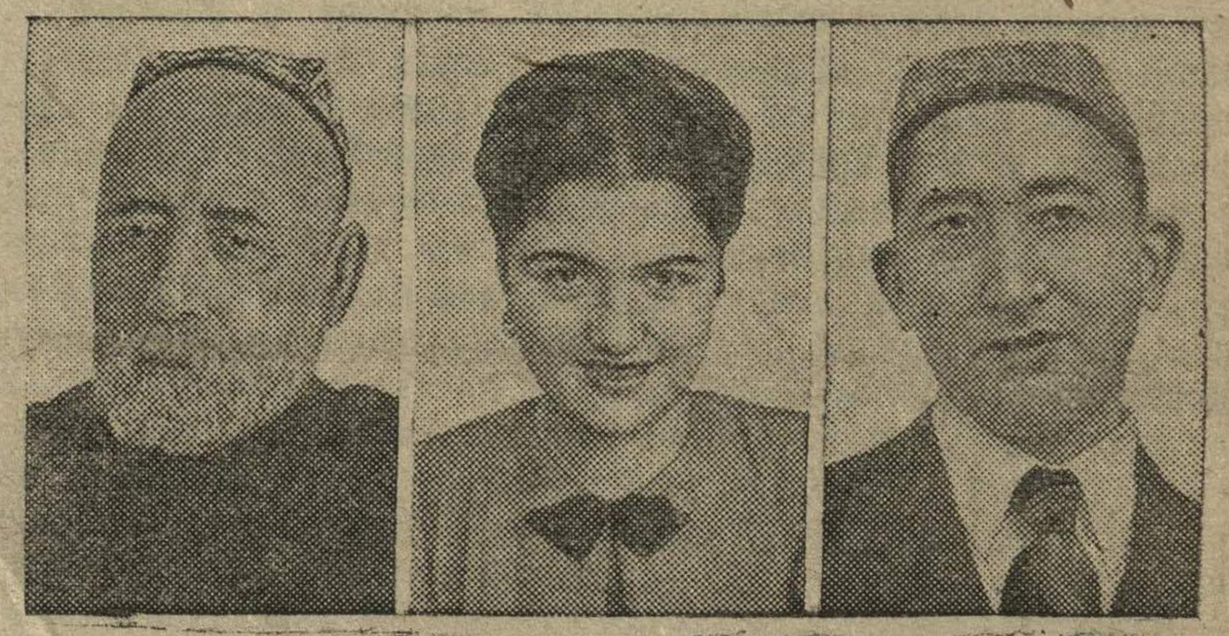
НА СНИМКЕ: Участники декады таджикского искусства в Москве, награжденные орденом Ленина за выдающиеся заслуги в деле развития таджикского театрального и музыкального искусства (слева направо): Заслуженный деятель науки Таджикской ССР, писатель Айни Садриддин, Заслуженная артистка Таджикской ССР, артистка Таджикского Государственного театра оперы и балета Галибова Рена и Народный артист СССР, артист Сталинабадского Академического театра драмы Касымов Мухамеджан. Фотохроника ТАСС.

В ЛАГЕРЕ ВЫСОКОШИРОТНОЙ ЭКСПЕДИЦИИ 28 апреля около 8 часов утра по местному времени жители ледового лагеря № 3 передали в Москву подробную радиограмму о работах и жизни участников высокоширотной воздушной экспедиции. —Научные наблюдения на льдине подходят к концу,—говорится в радиограмме.—В лагере № 3 самой трудоемкой работой оказалось строительство ледового аэродрома. Жесткие снежные заструги с трудом поддаются ударам стальных лопат. Теперь аэродром (вернее—взлетная дорожка) почти готов. Остается проложить путь от места стоянки самолета «СССР Н-169» к старту. Вылет намечен на 30 апреля. (ТАСС).