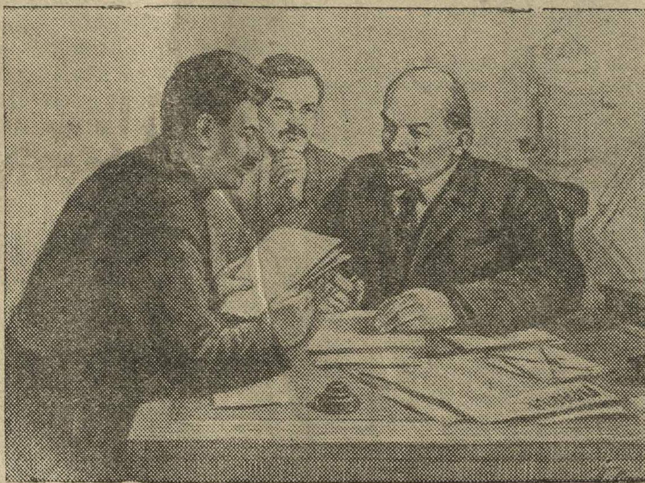
В. И. Ленин, И. В. Сталин и В. М. Молотов в редакции газеты «Правда» — 1917 г. Репродукция из альбома издательства «Искусство» — «Ленин и Сталин» Рисунок художника И. Васильева.

Большевистский привет армии работников печати в день 5 мая!