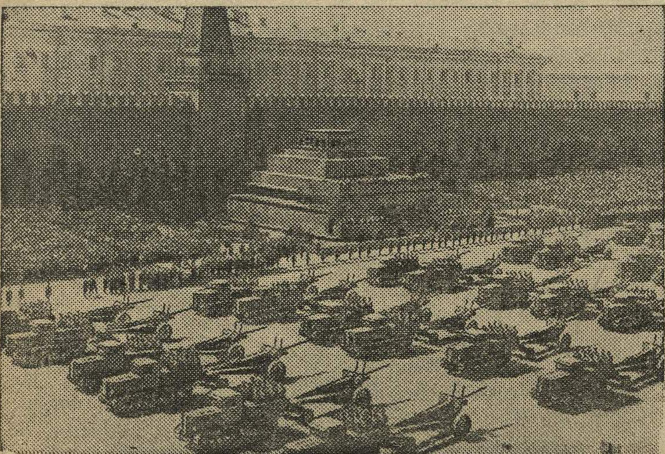
Парад войск на Красной площади. Артиллерия на параде.