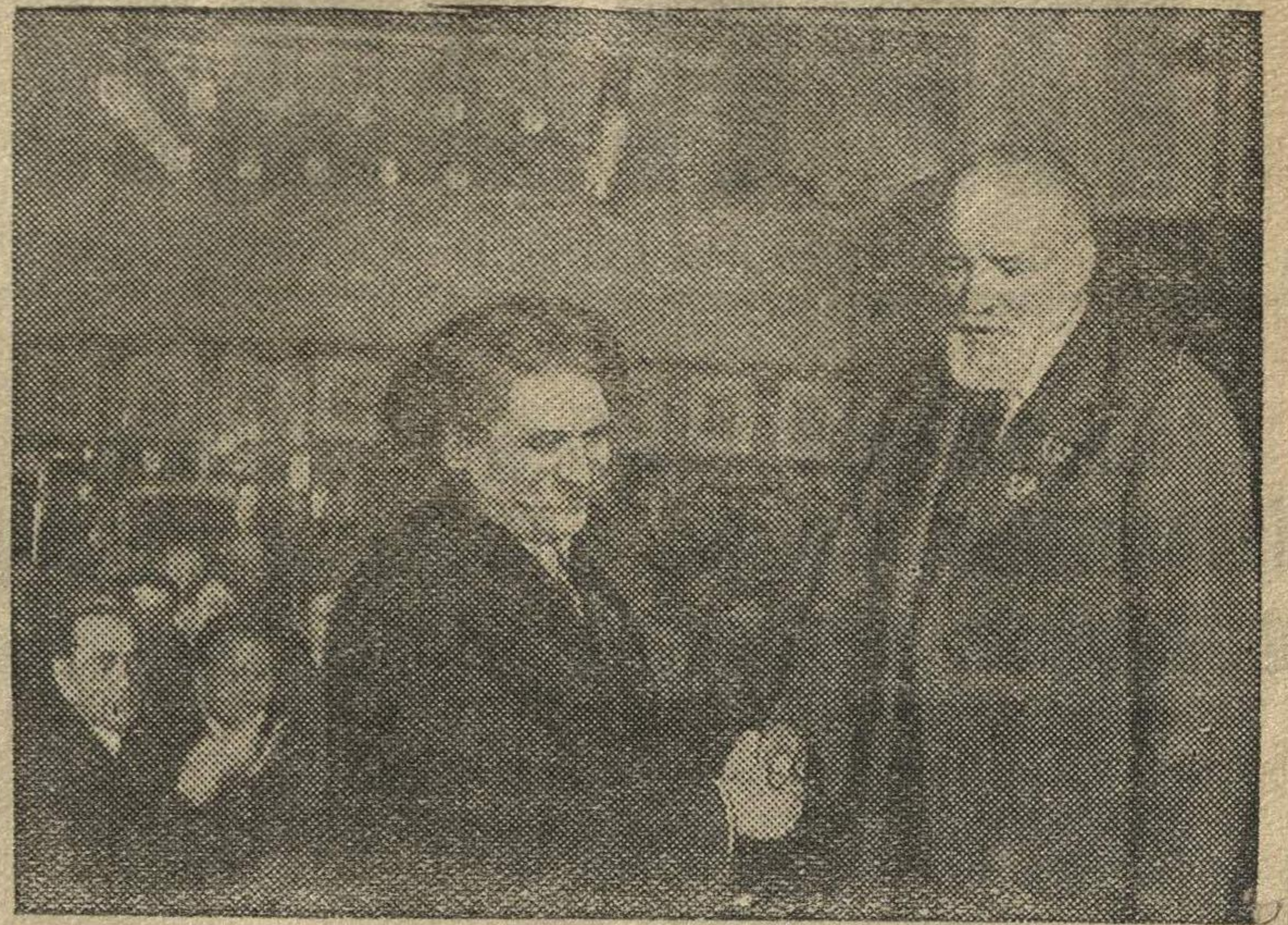
НА СНИМКЕ: Председатель Комитета по Сталинским премиям в области литературы и искусства В. И. Немирович-Данченко поздравляет писателя С. Н. Сергеева Ценского.

21 и 22 апреля в Москве состоялось вручение дипломов и денежных премий лауреатам Сталинской премии — деятелям науки, изобретательства, искусства и литературы.