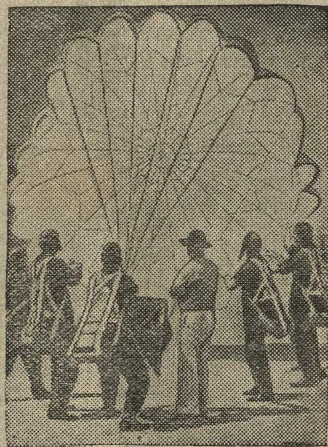
Обучение парашютистов приемам владения парашютом в момент приземления.