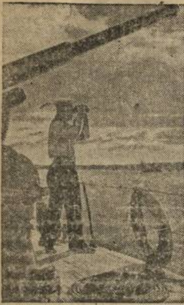
На боевой вахте.