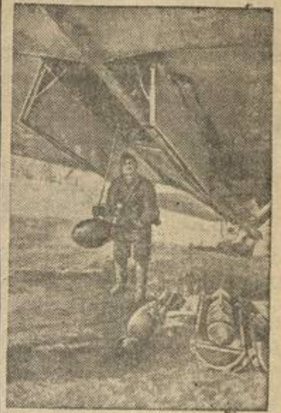
Перед боевым вылетом.