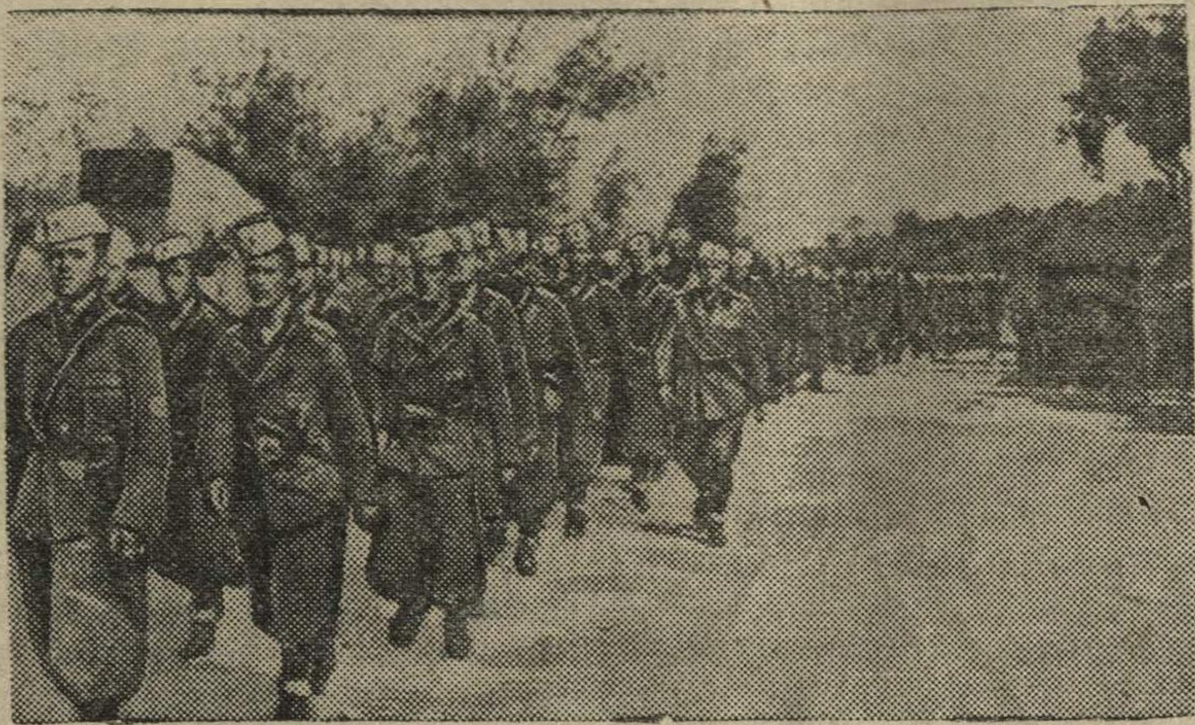
Итальянские войска в Албании.