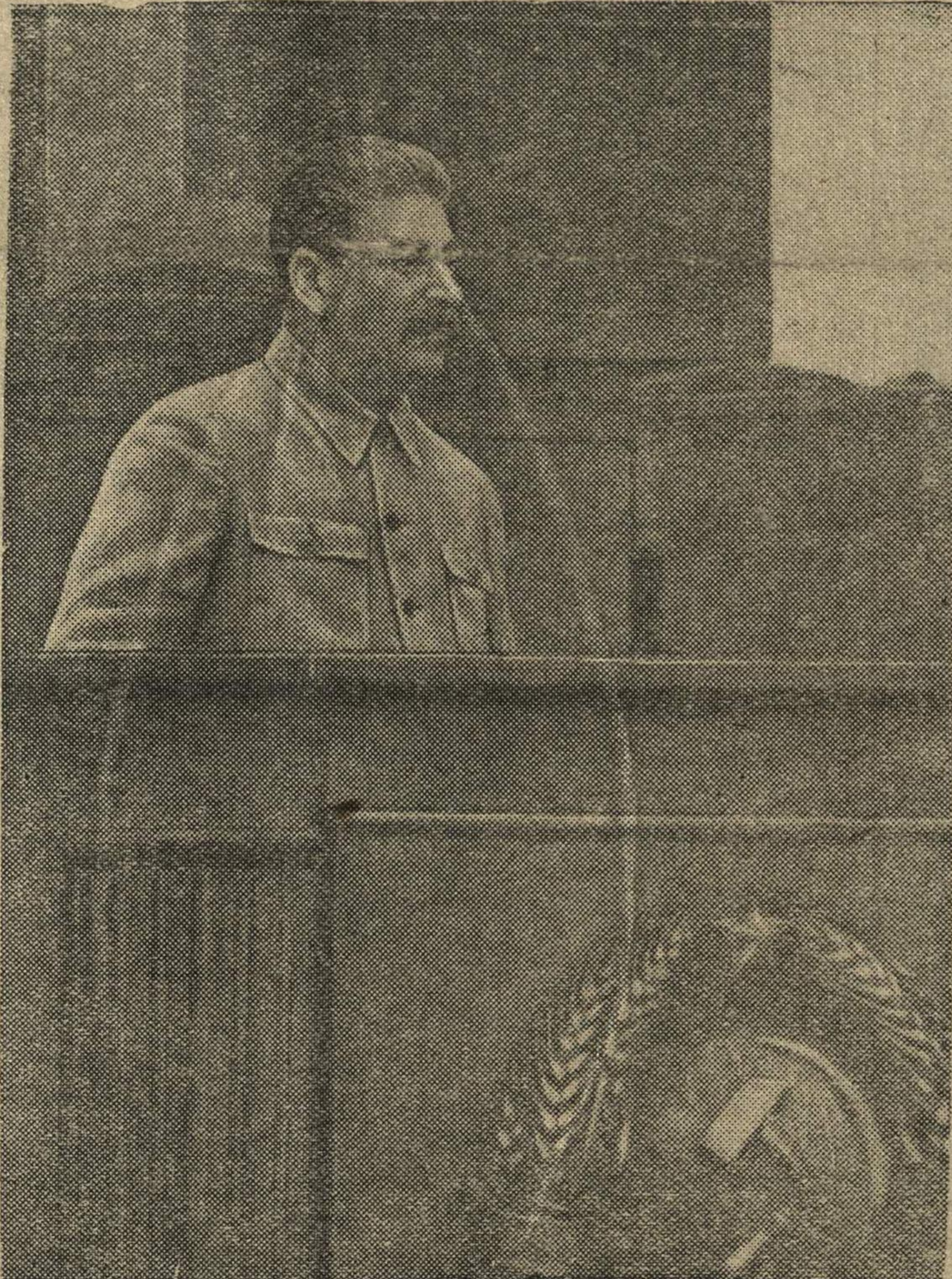
Выступление товарища И. В. Сталина на торжественном собрании, посвященном выпуску командиров, окончивших военные академии, состоявшемся в Большом Кремлевском дворце 5-го мая 1941 года.

Задача руководителей предприятий и стахановцев промышленности и сельского хозяйства заключается в том, чтобы ежедневно работать над освоением новой техники, двигать непрерывно технику вперед, как этого требует XVIII Всесоюзная конференция ВКП(б).