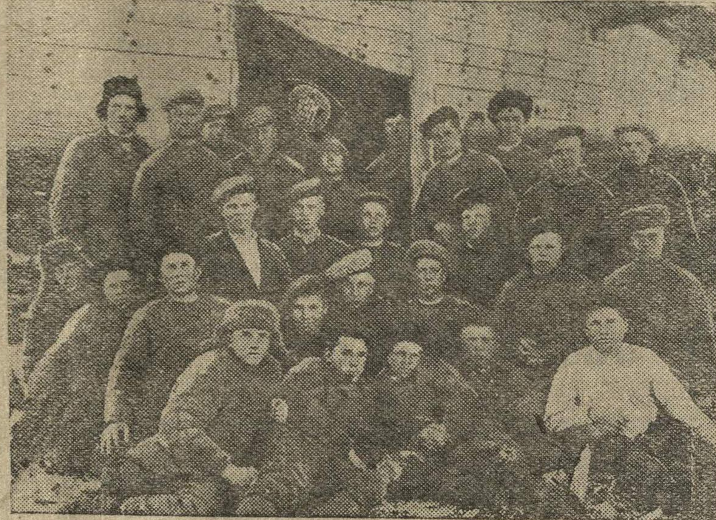
НА СНИМКЕ: первая группа учеников-судоплотников школы ФЗО № 9 у судна, сделанного своими руками. В предмайском соревновании эта группа завоевала переходящее красное знамя школы.