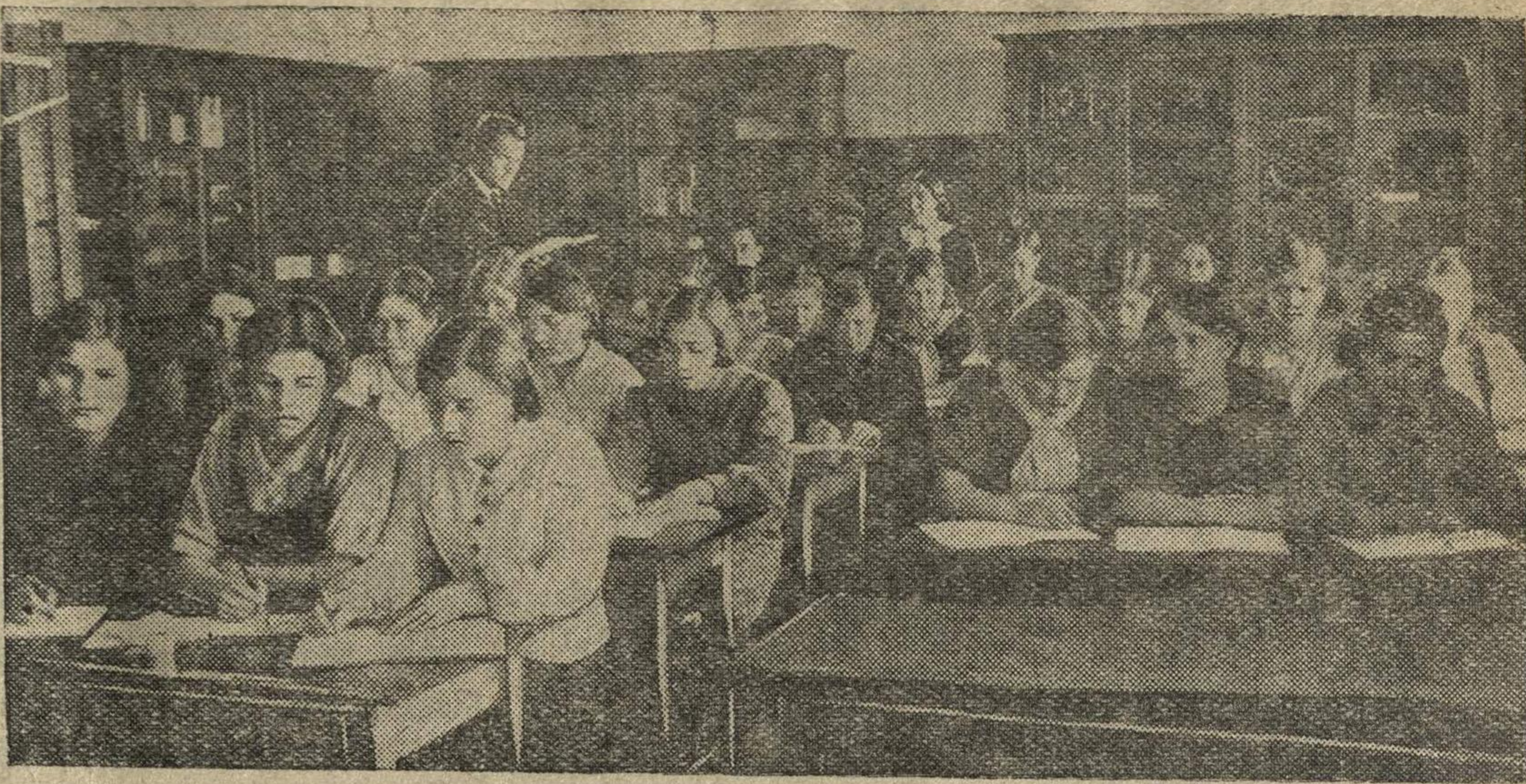
На уроке русского языка в III классе „Б“ Городецкого педучилища.