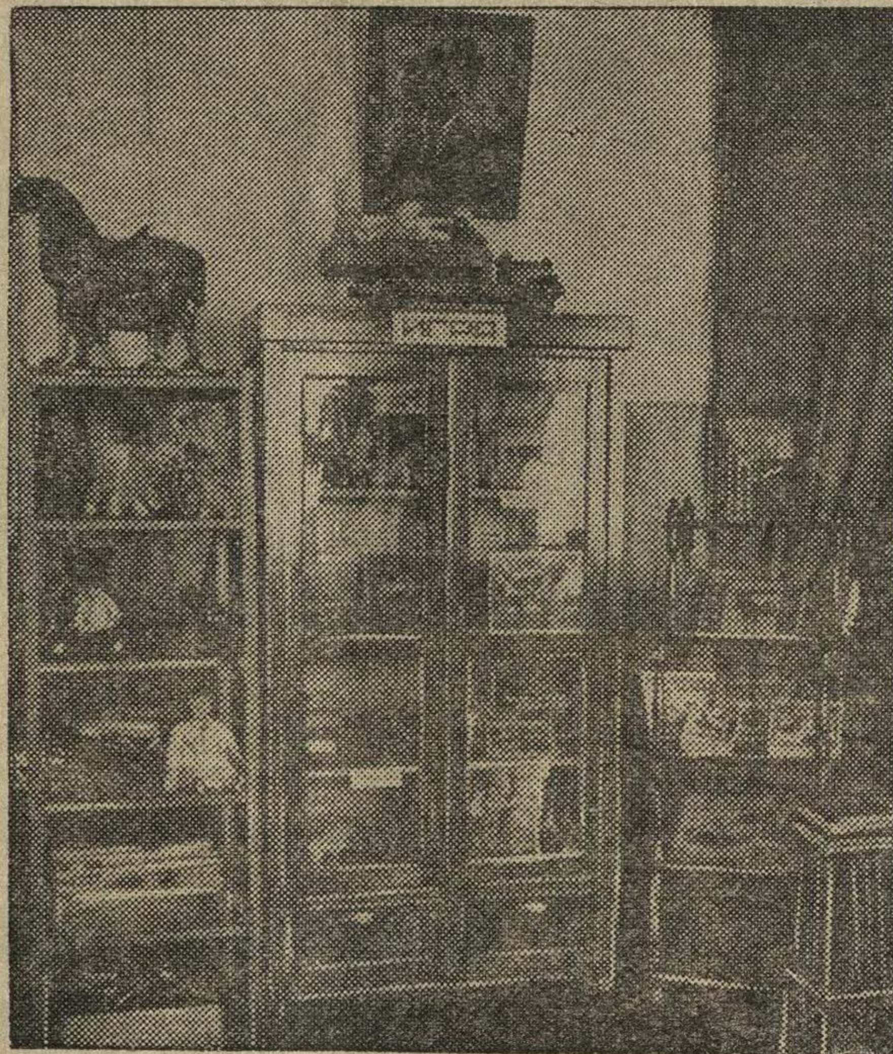
Уголок детских игр в методкабинете Городецкого педучилища.