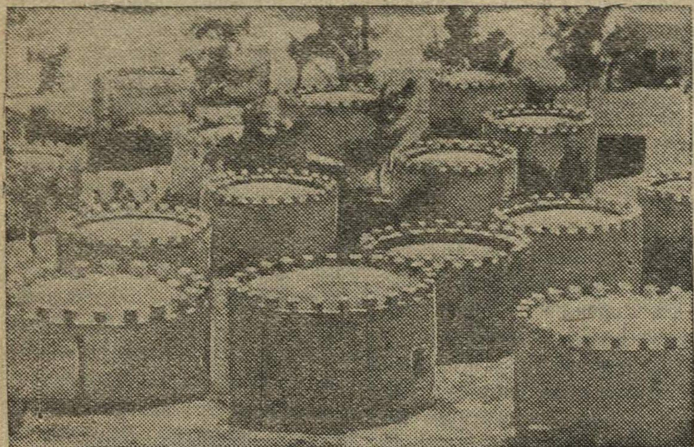
Жилища туземцев в Аддис-Абебе (Абиссиния).