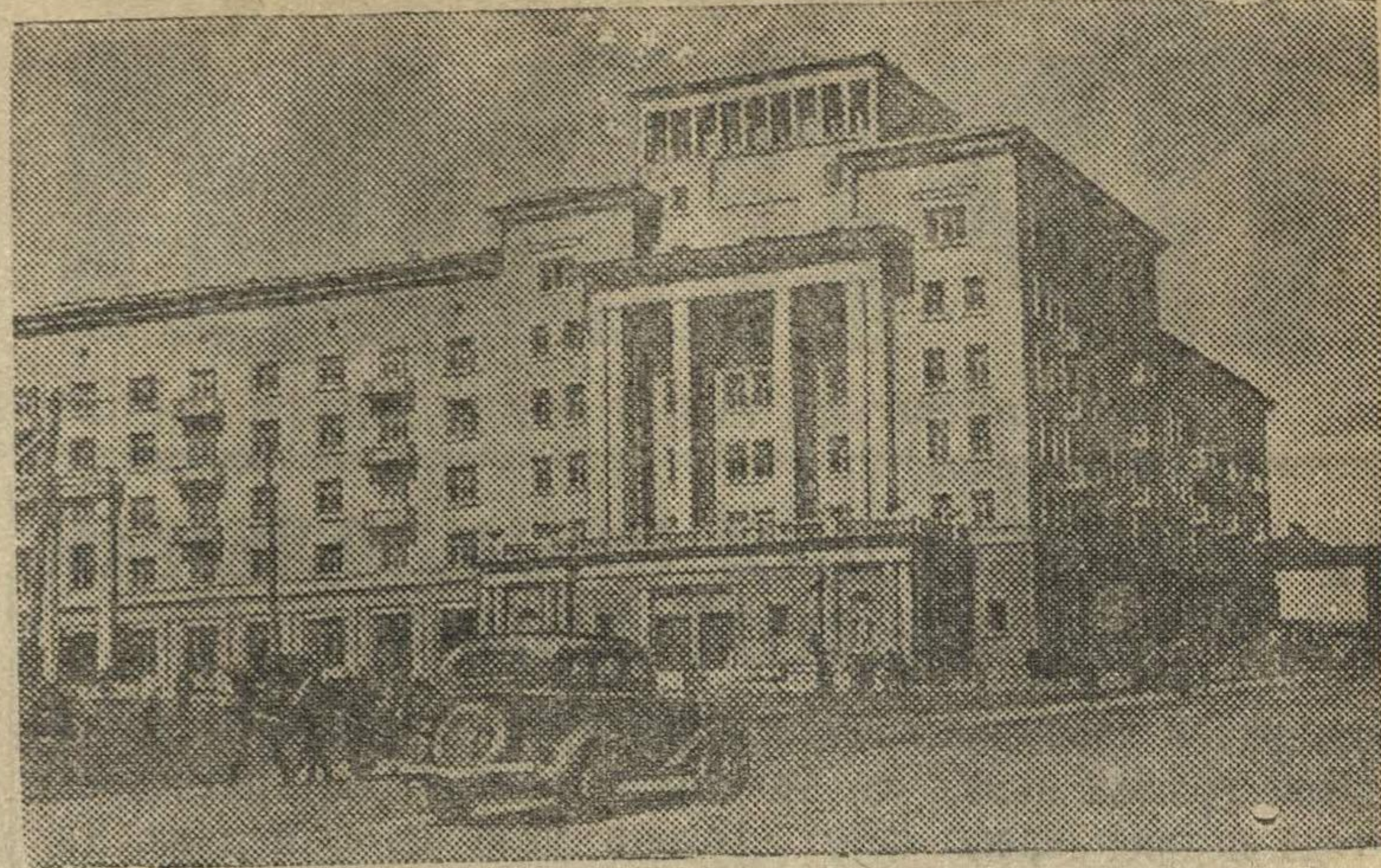
Новая гостиница в Смоленске, законченная строительством во втором квартале 1941 года.