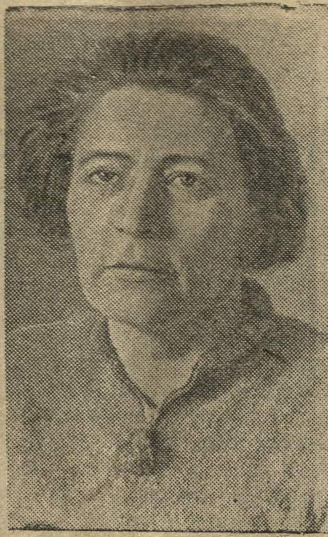
На снимке: Анта Паукер — одна из активных деятелей рабочего движения в Румынии, долгое время находившаяся в заключении. В результате переговоров между правительствами СССР и Румынии тов. Паукер освобождена из тюрьмы. Она прибыла в СССР и находится в Москве.