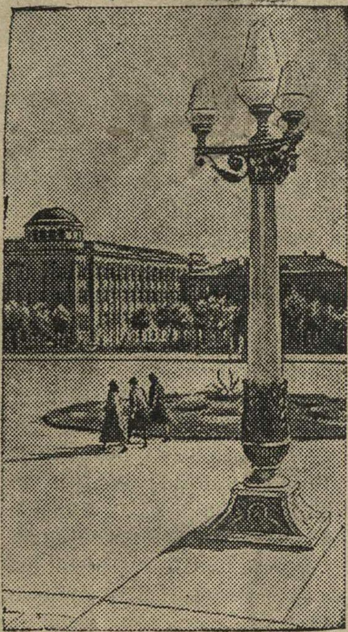
На театральной площади в г. Ереване (Армянская ССР).