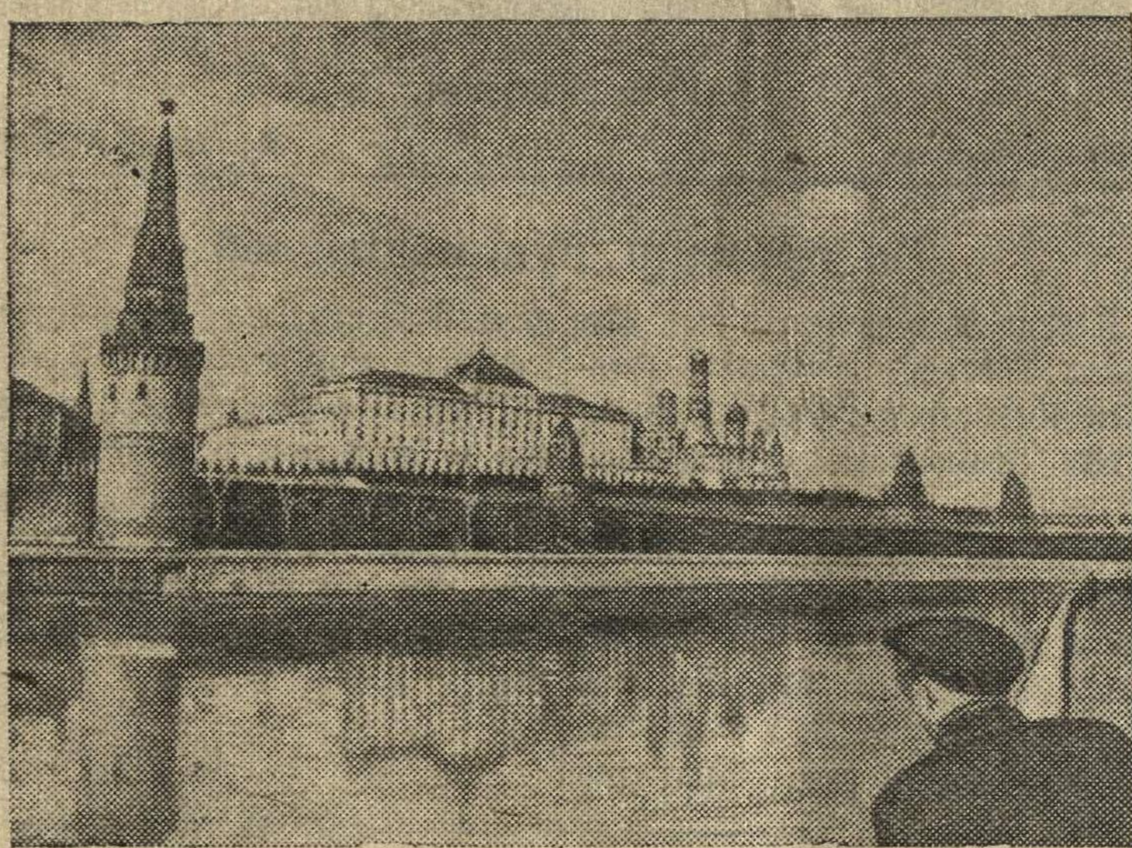
Вид на Кремль с Большого Каменного моста (Москва).