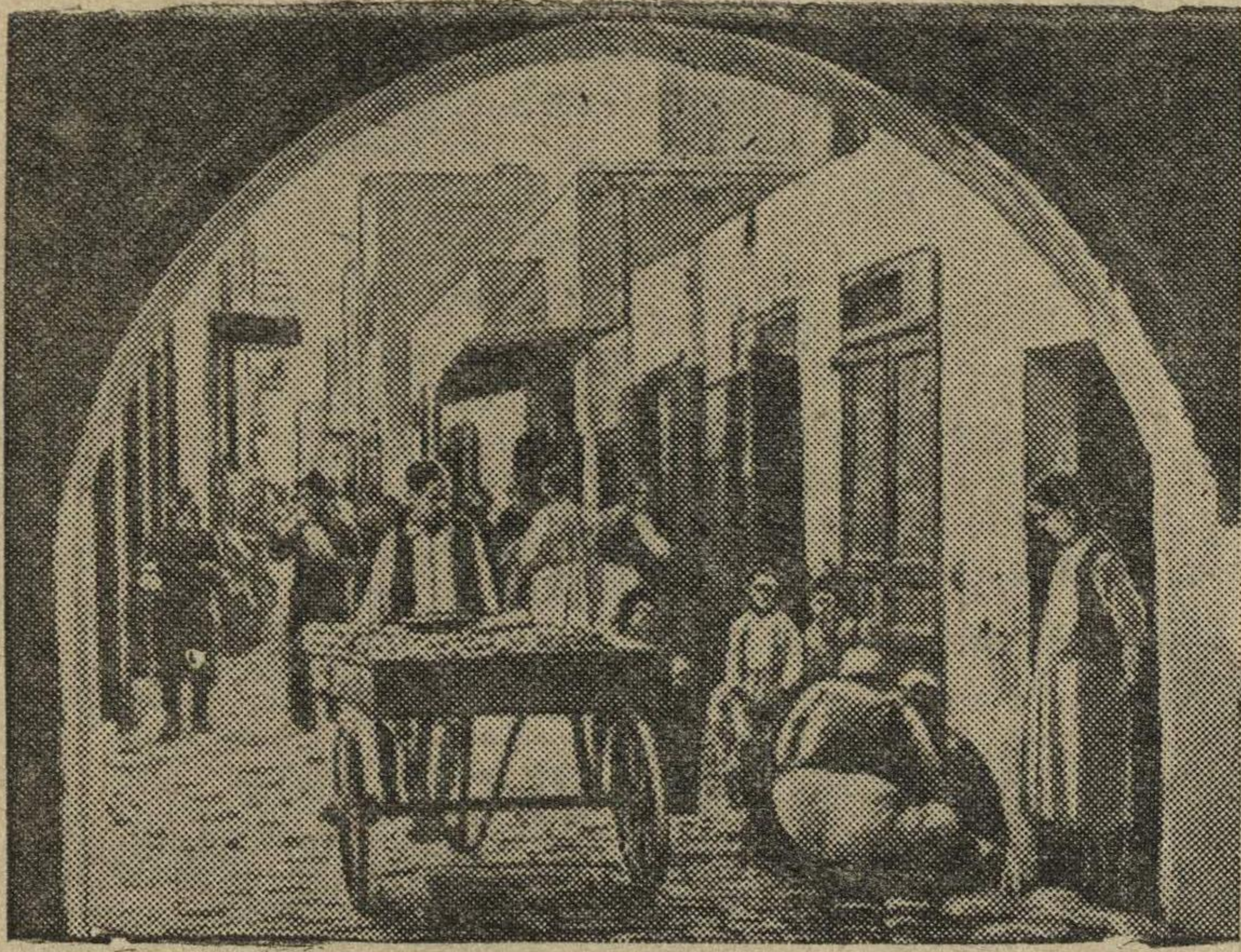
Туземный квартал в Триполи (главный город и порт в Ливии, Северная Африка).