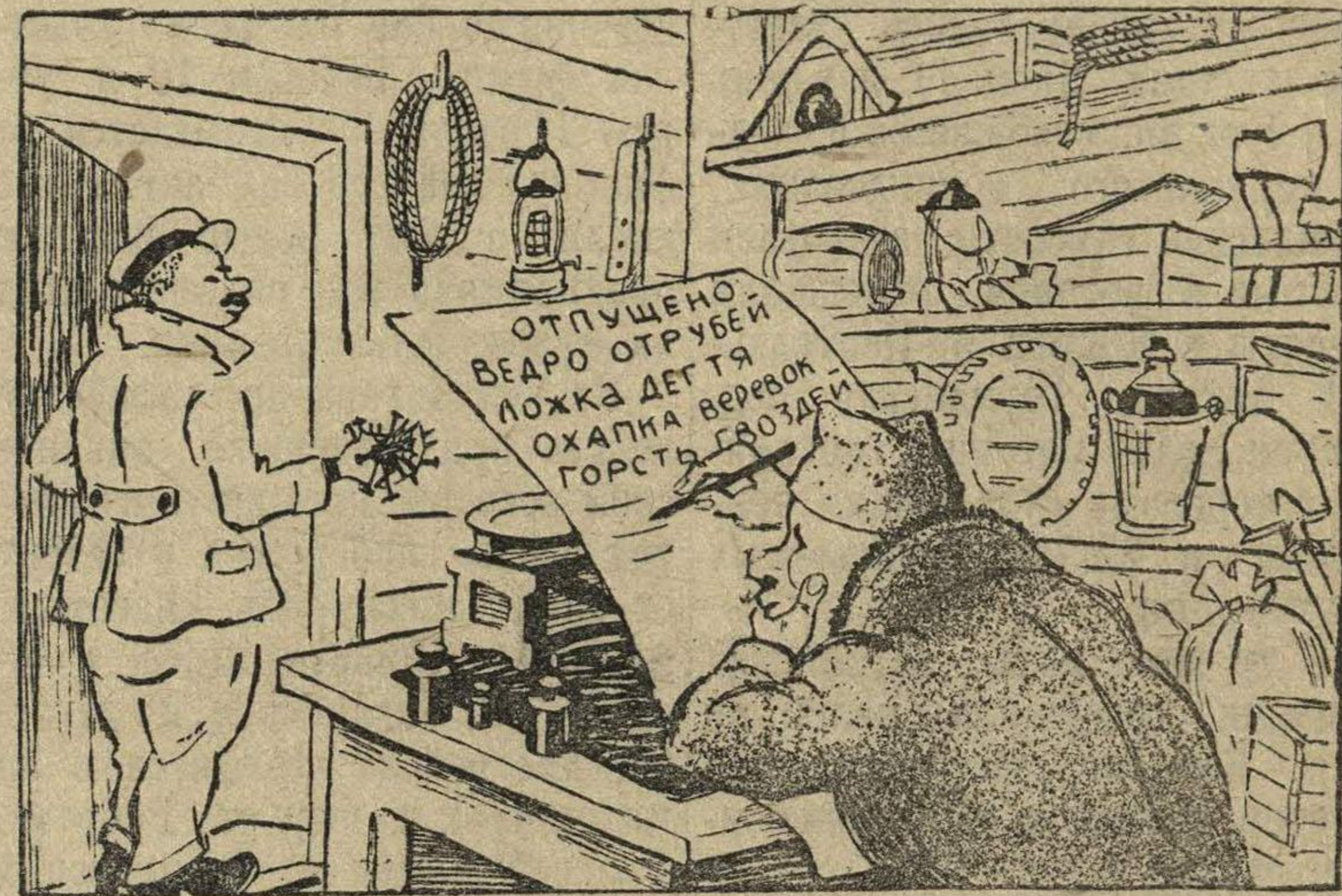
Рисунск Б. Анфилова

Кладовщик второй бригады колхоза «12 лет Октября» А. Александров безответственно относился к делу, допустил вопиющую бесхозяйственность, запустил учет. У него нехватало разных продуктов и материалов более чем на 15 тыс. руб. Правление колхоза связало Александра с работы и передало на него материал в следственные органы для привлечения к ответственности.