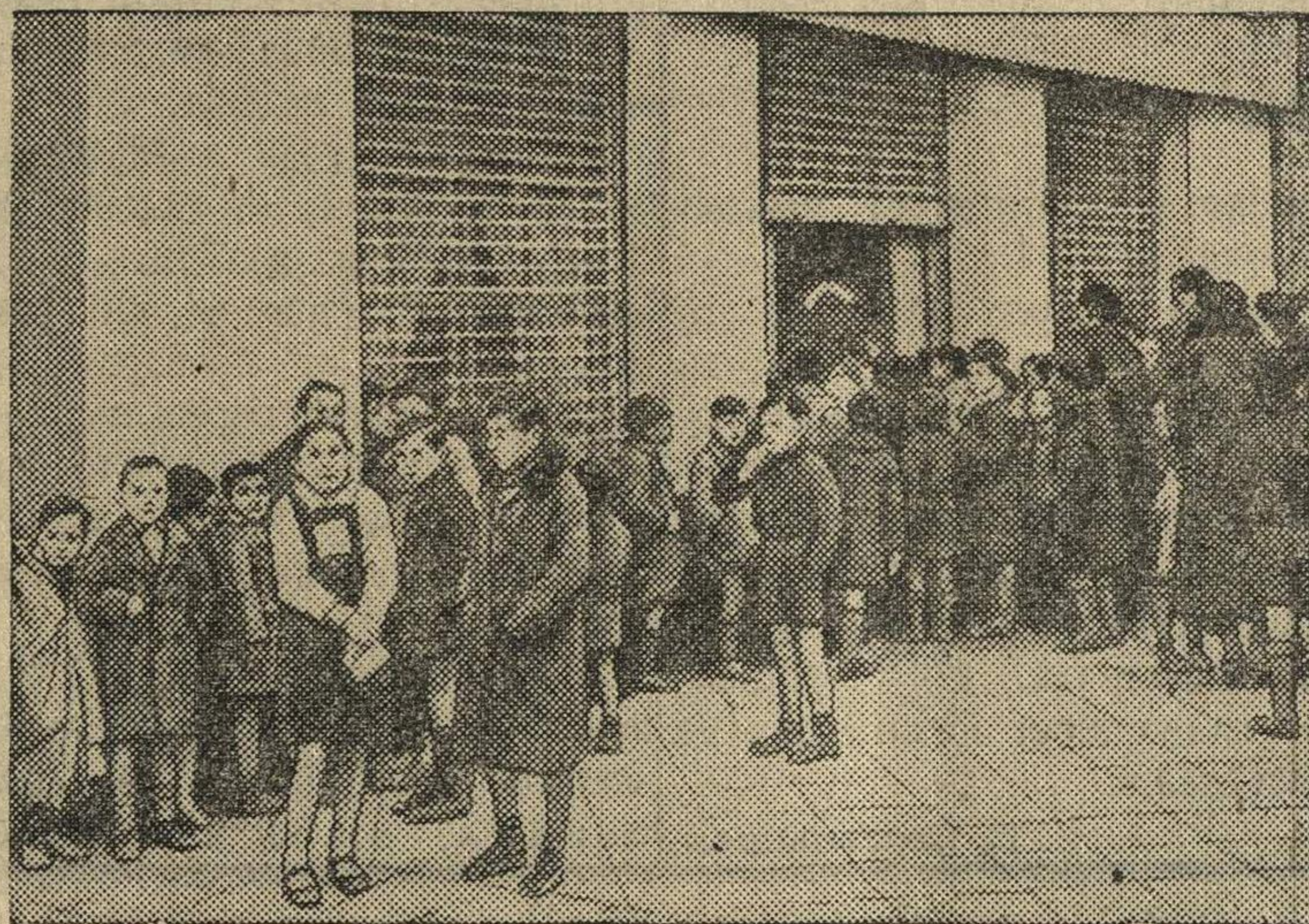
В ожидании очередного пайка в Испании.