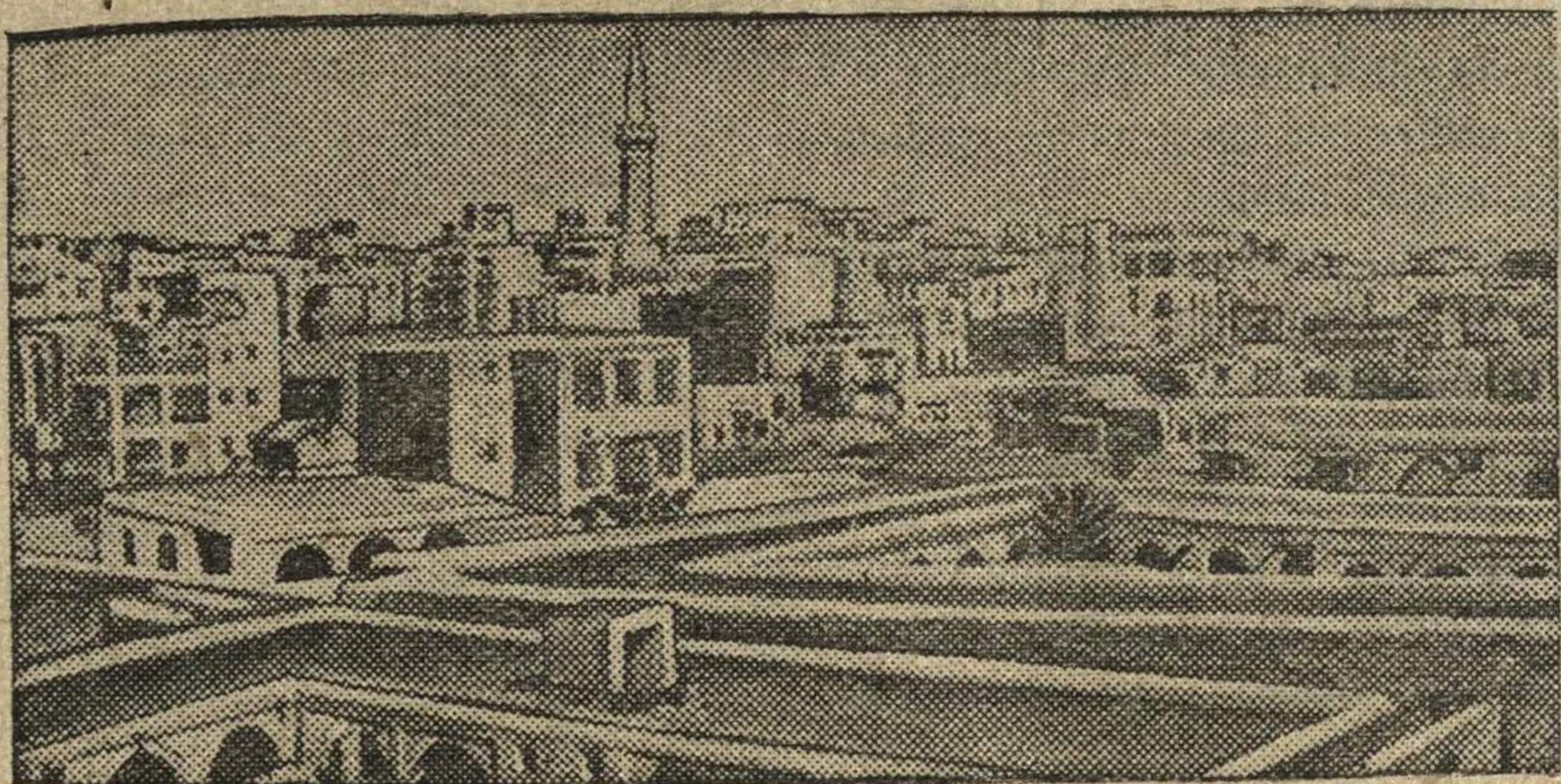
Вид на Каир (Египет).

вспыхнула крупная забастовка нефтяников. Рабочие потребовали повышения зарплаты. (ТАСС).