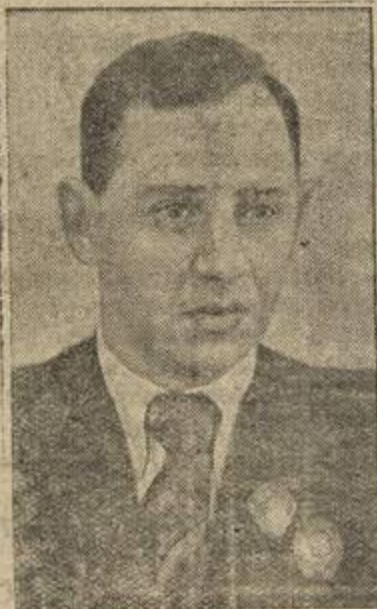
Герой Социалистического Труда И. М. Зальцман.

За выдающиеся достижения в области организации серийного производства новых типов танков Президиум Верховного Совета СССР присвоил звание Героя Социалистического Труда Зальцману Исмаку Моисеевичу — директору Кировского завода.