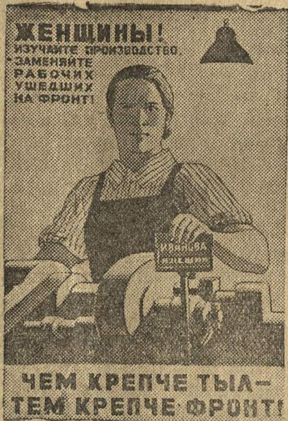
Рисунок художника О. Эйгес. (Репродукция с плаката, выпущенного издательством «Искусство».)