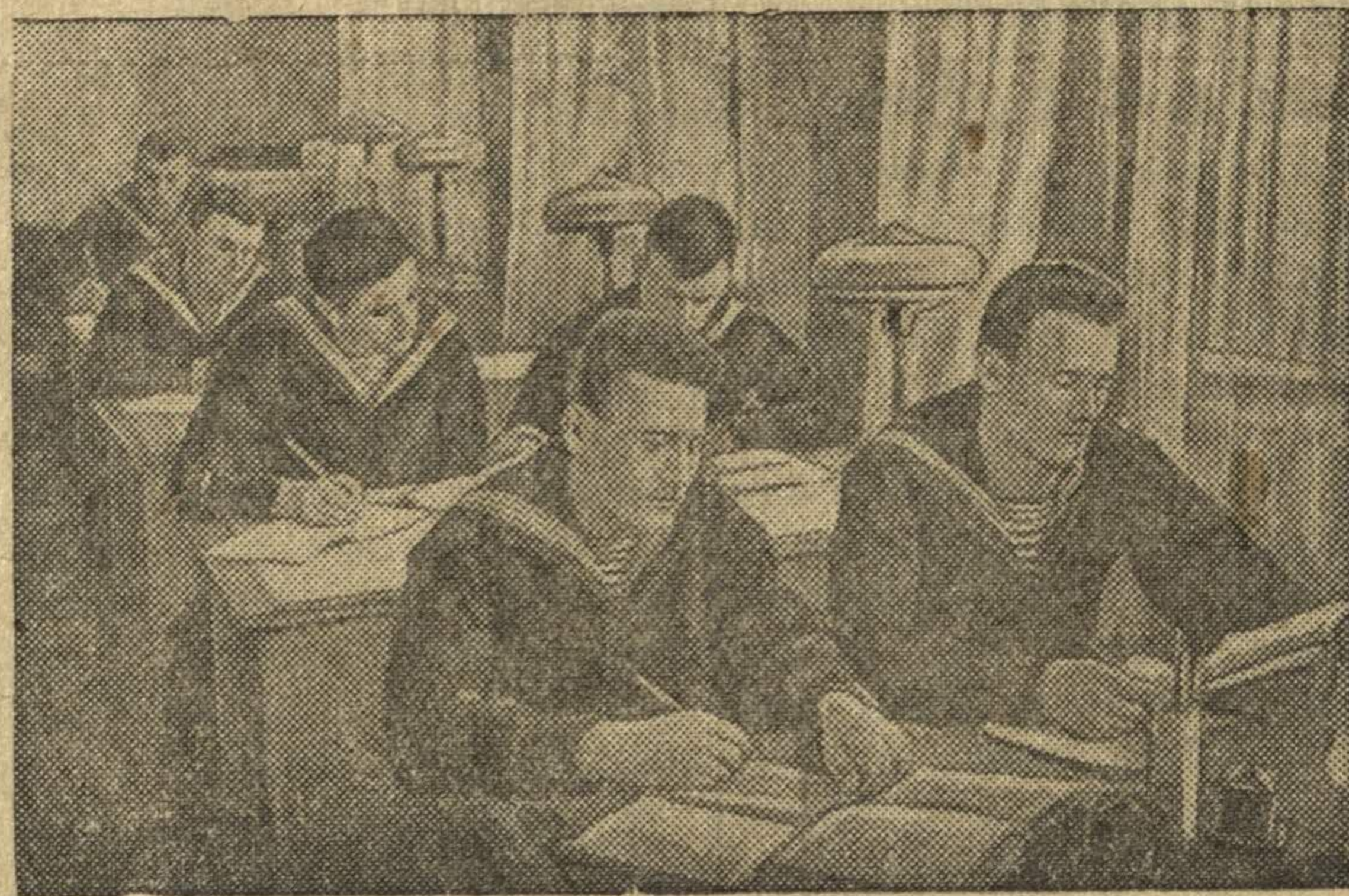
Пинская флотилия (БССР). Краснофлотцы комсомольцы за изучением Краткого курса истории ВКП(б).