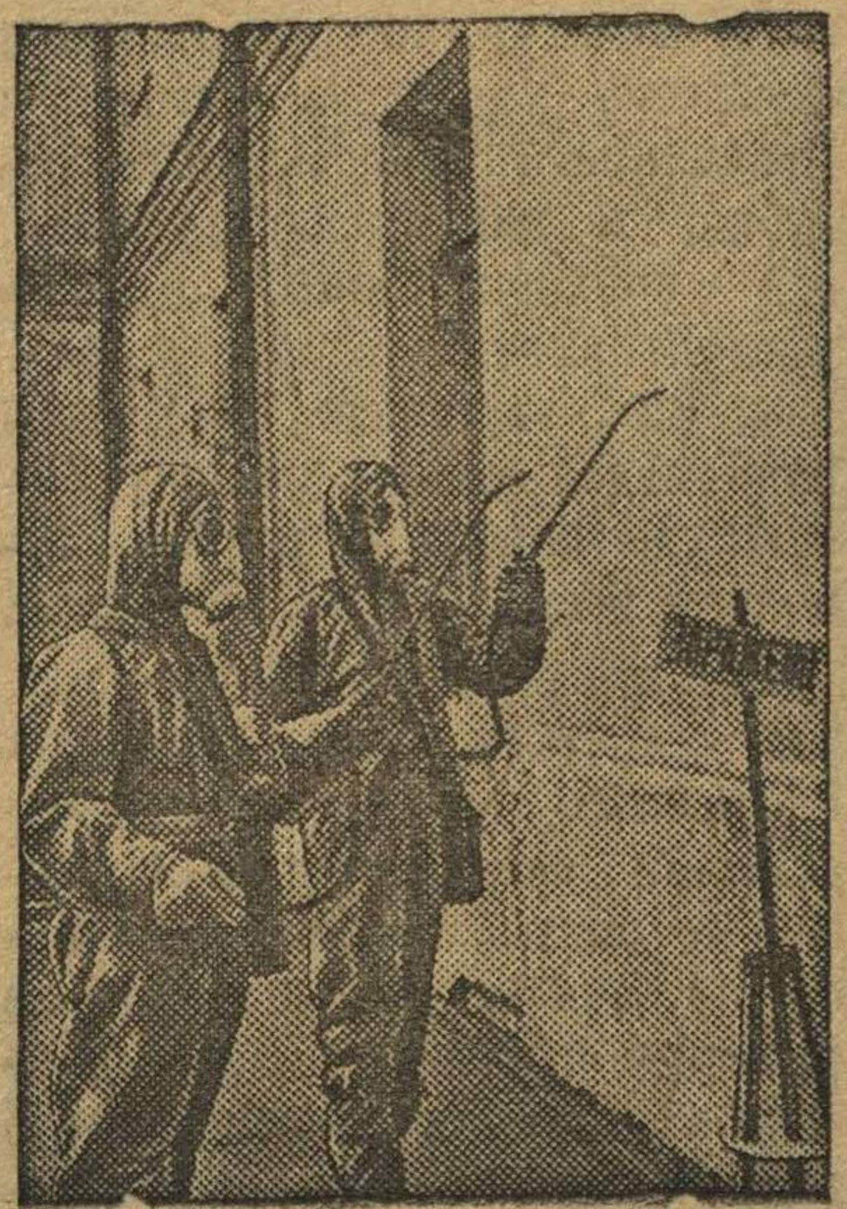
Очередное заседание дегазационного отделения.

Комсомольская унитарная команда МПВО Юридического института Прокуратуры Союза ССР (Москва)