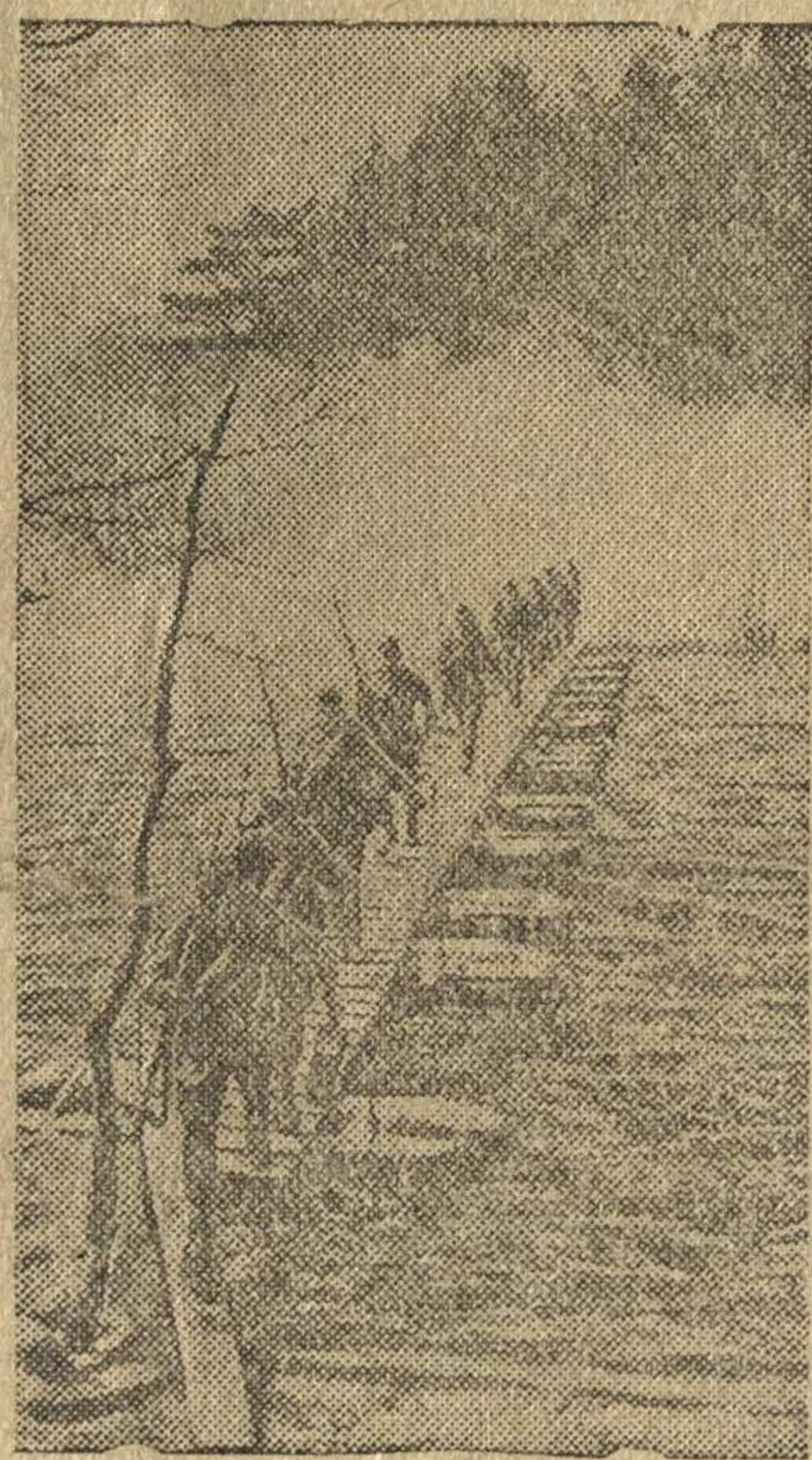
Форемирование водной преграды.