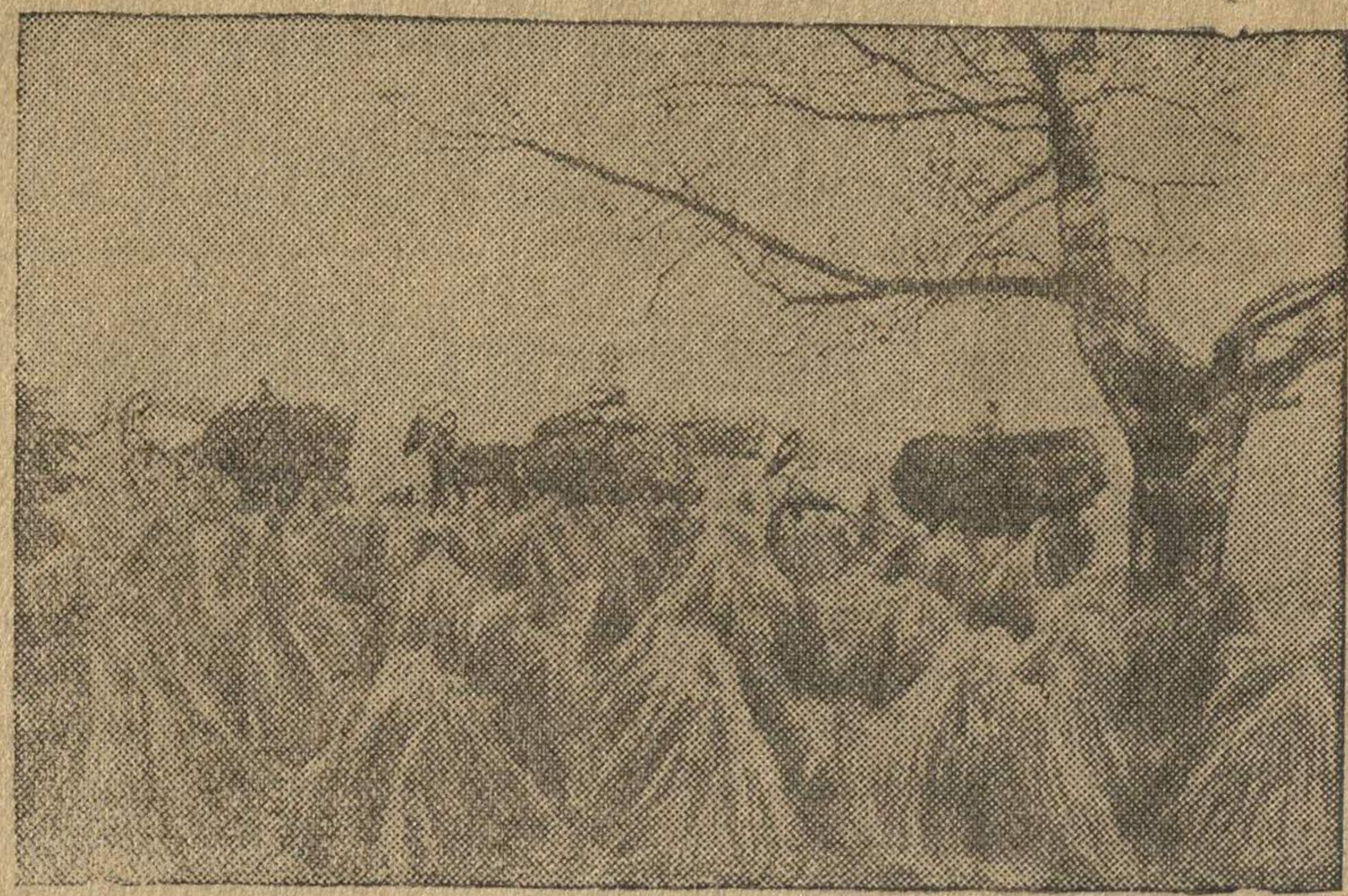
Возка льняной тресты в колхозе «Чирки» Пектубаевского района. Марийской АССР. (Репродукция из альбома «Смотр побед социалистического сельского хозяйства», выпущенного изд-вом «Сельхозгиз» фото А. Скурихина).

Как сообщает агентство Рейтер, за период с 16 июня по 10 июля на Кельн сброшено около тысячи тонн бомб. Свыше 500 тонн бомб сброшено на Бремен. За этот же период на Рурскую промышленную область сброшено свыше 2 тысяч тонн бомб. Во время дневных налетов на Северную Францию английские самолеты бомбардировали 3 промышленных предприятия, 3 электростанции, используемые немцами для промышленных целей. Из 3 электростанций в Лилле 2 были выведены из строя. (ТАСС).