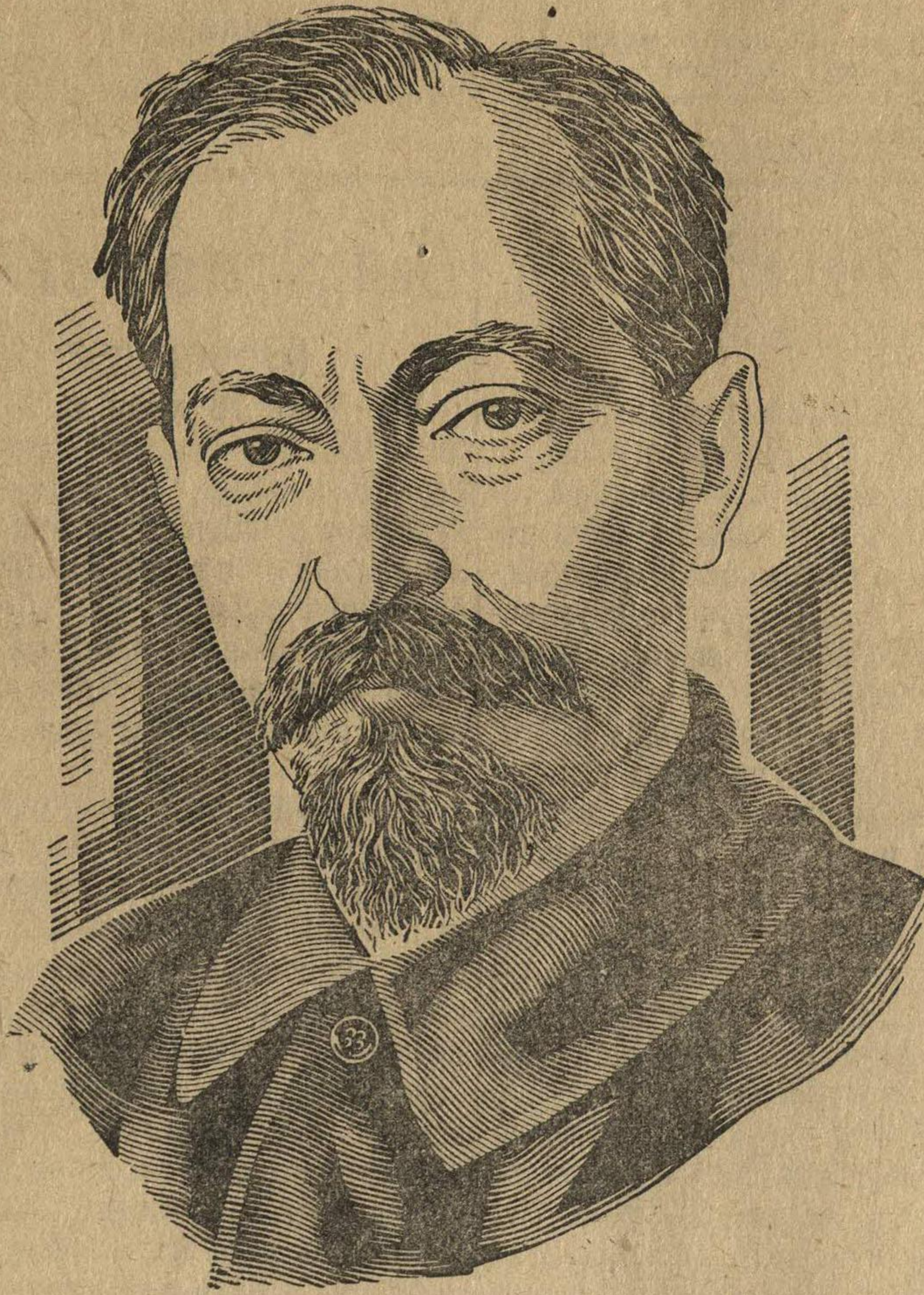
Феликс Эдмундович Дзержинский.

В декабре 1917 г. советское правительство назначает Ф. Э. Дзержинского председателем