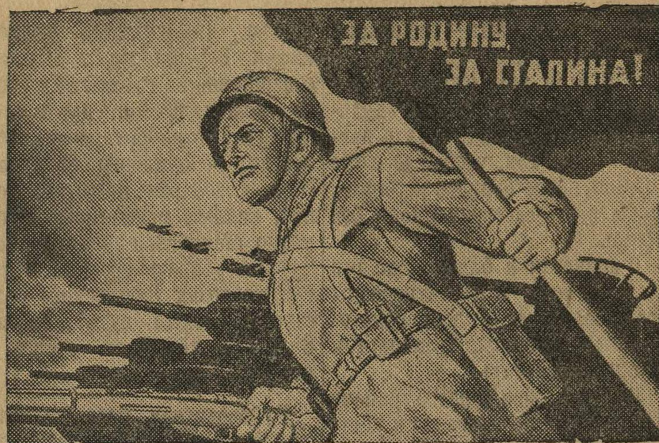
Рисунок лауреата Сталинской премии И. Тоидзе. (Репродукция с плаката, выпускаемого издательством „Искусство“).