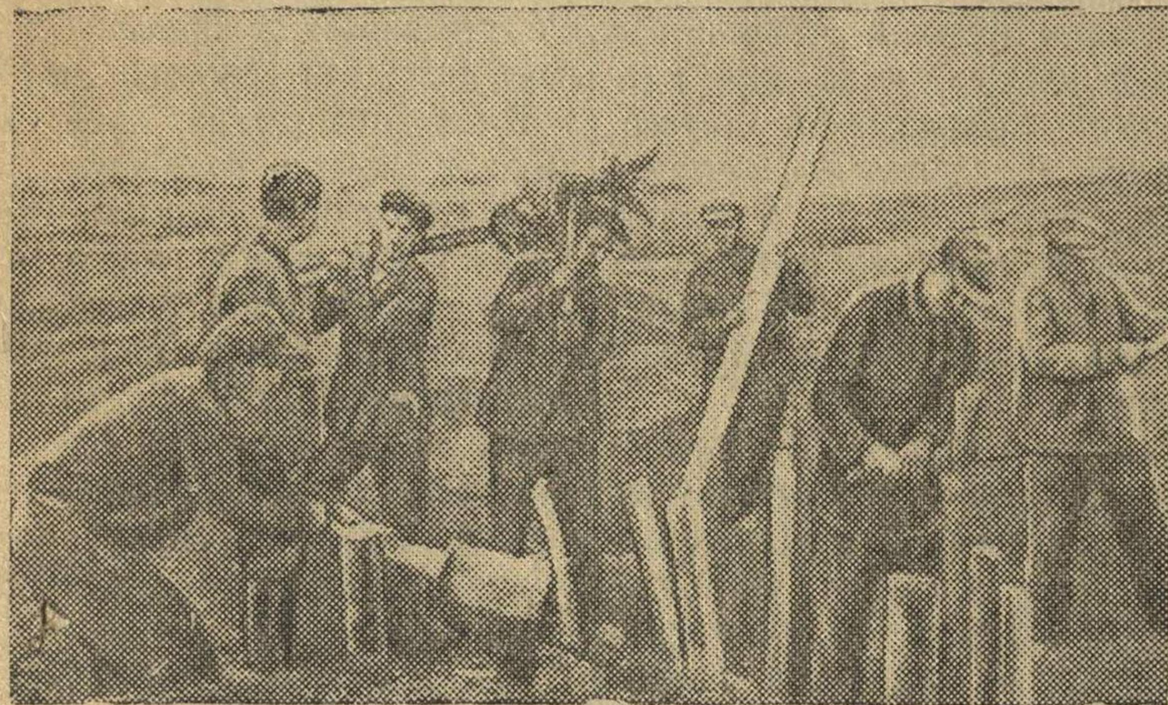
Колхозники строят противотанковые препятствия.

Население прифронтовой полосы самоотверженно помогает бойцам Красной Армии в борьбе против фашистских захватчиков.