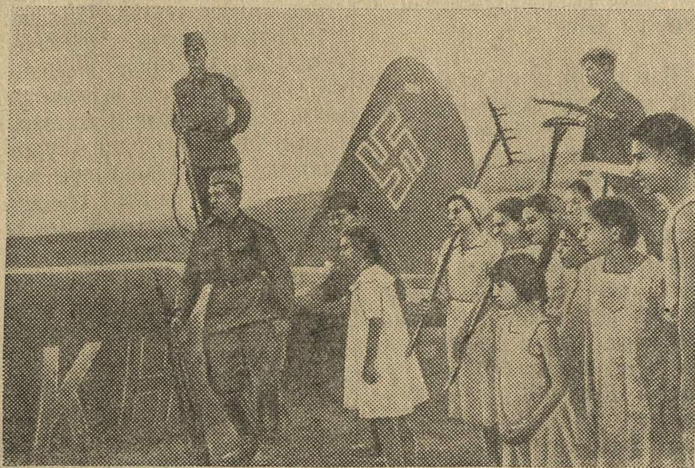
Фашистский самолет, сбитый отважными советскими летчиками.