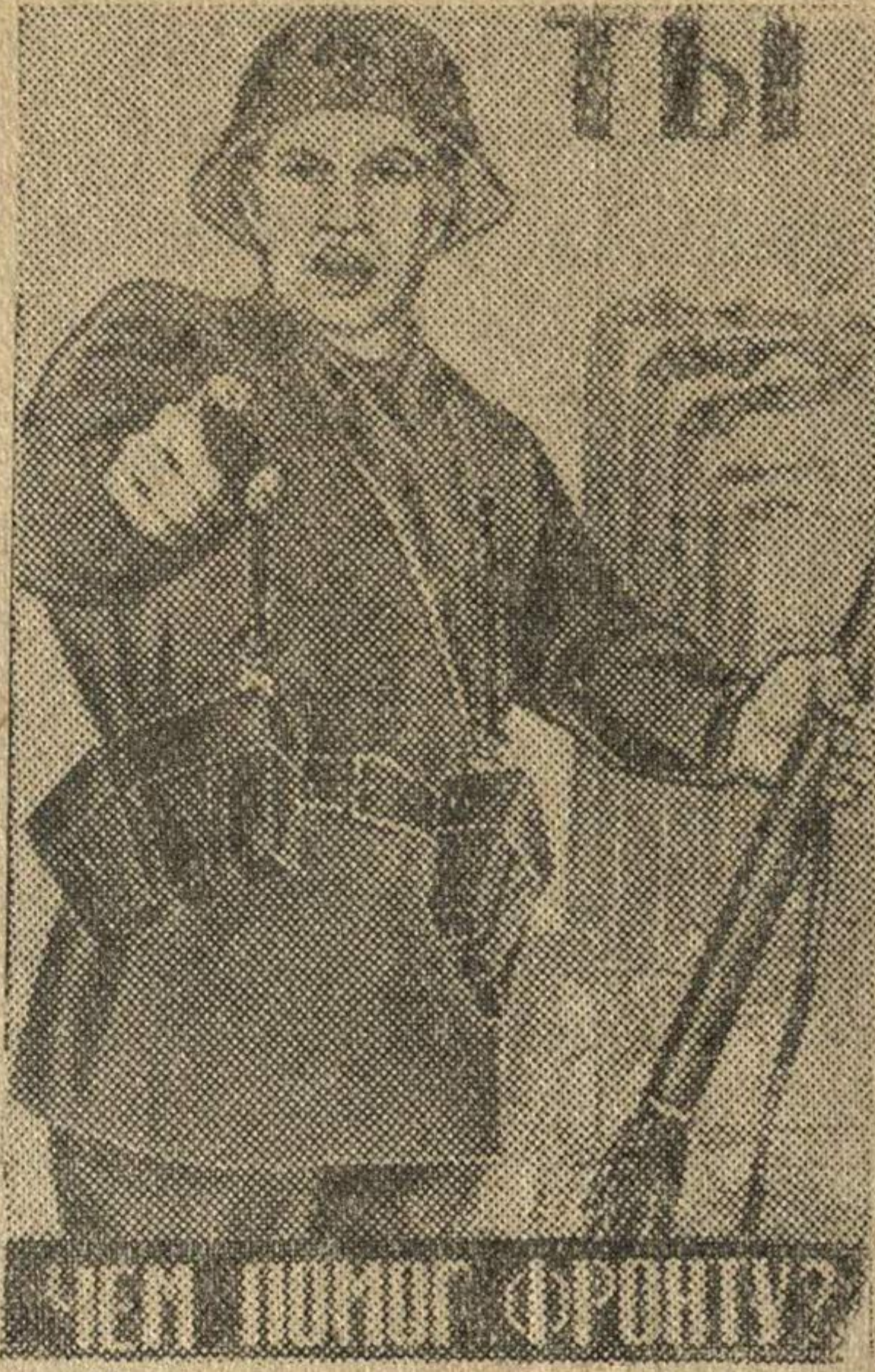
Рисунок художника Моор. (Репродукция с плаката, выпускаемого издательством «Искусство».)

Лейтенант Ридный нередко делает в день по несколько боевых вылетов. Он сопровождает наши бомбардировщики, перехватывает противника, штурмует его войска и аэродромы.