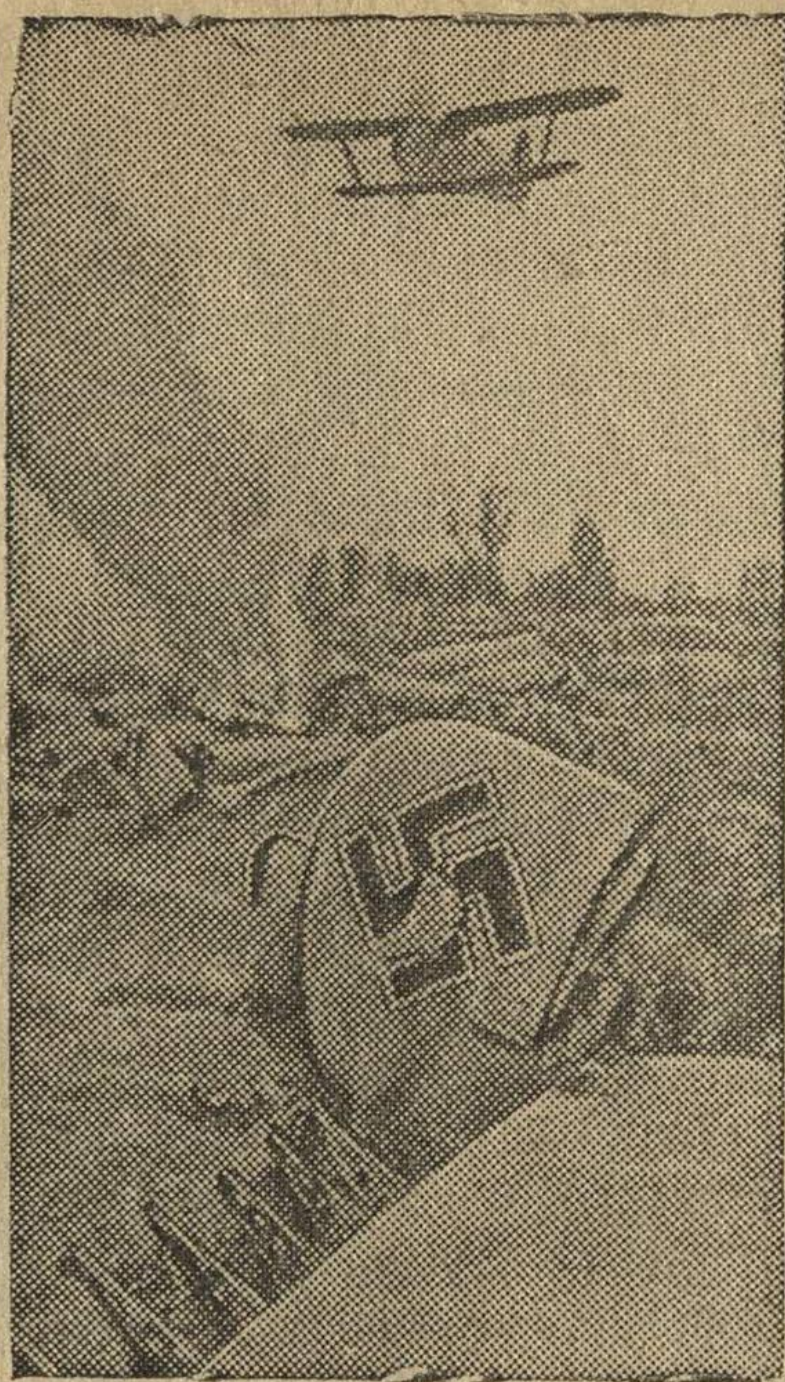
Славный советский сокол парит над сбитым им фашистским стервятником.