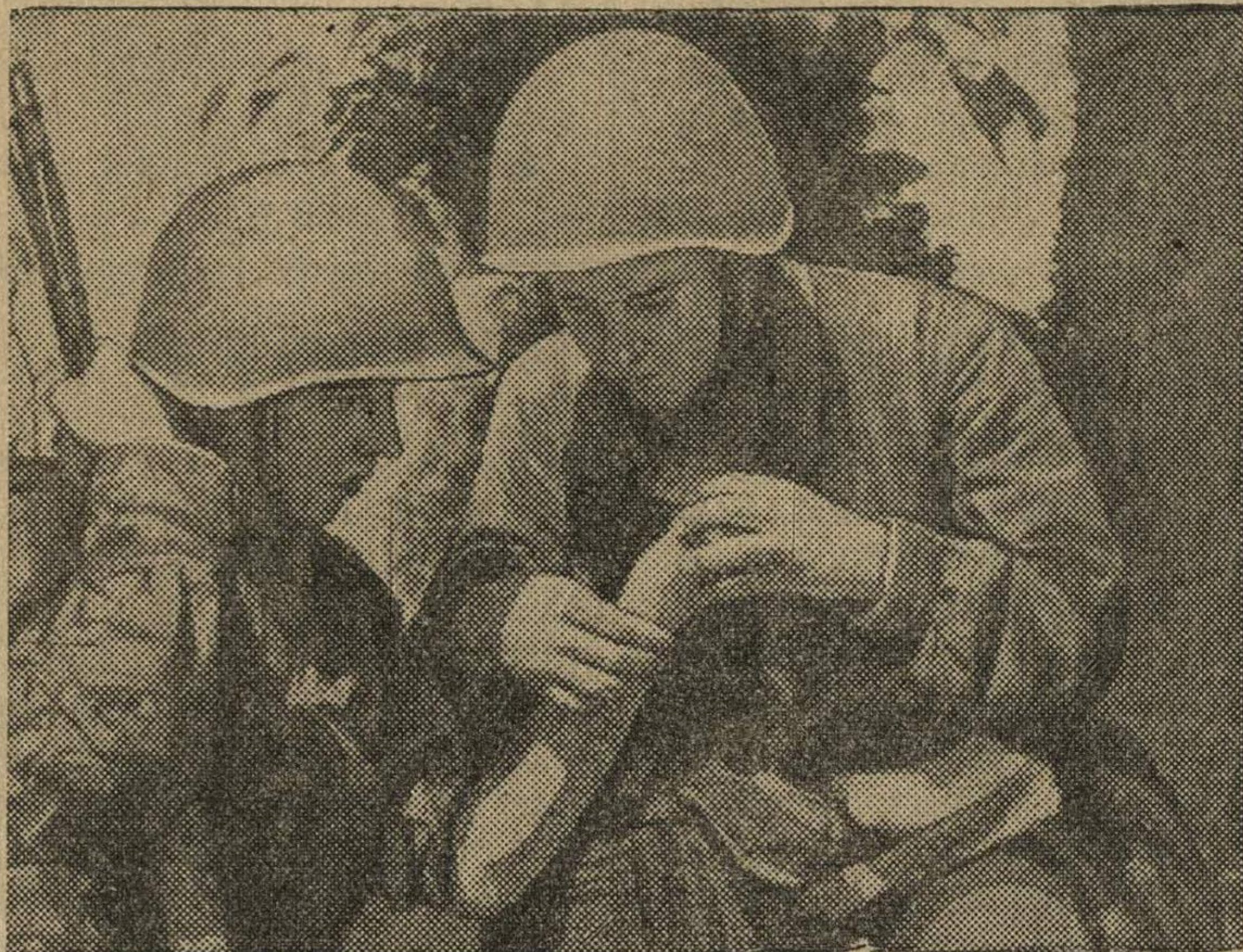
Оказание первой помощи раненому бойцу. (С'емка специальных корреспондентов Союзкинохроники).