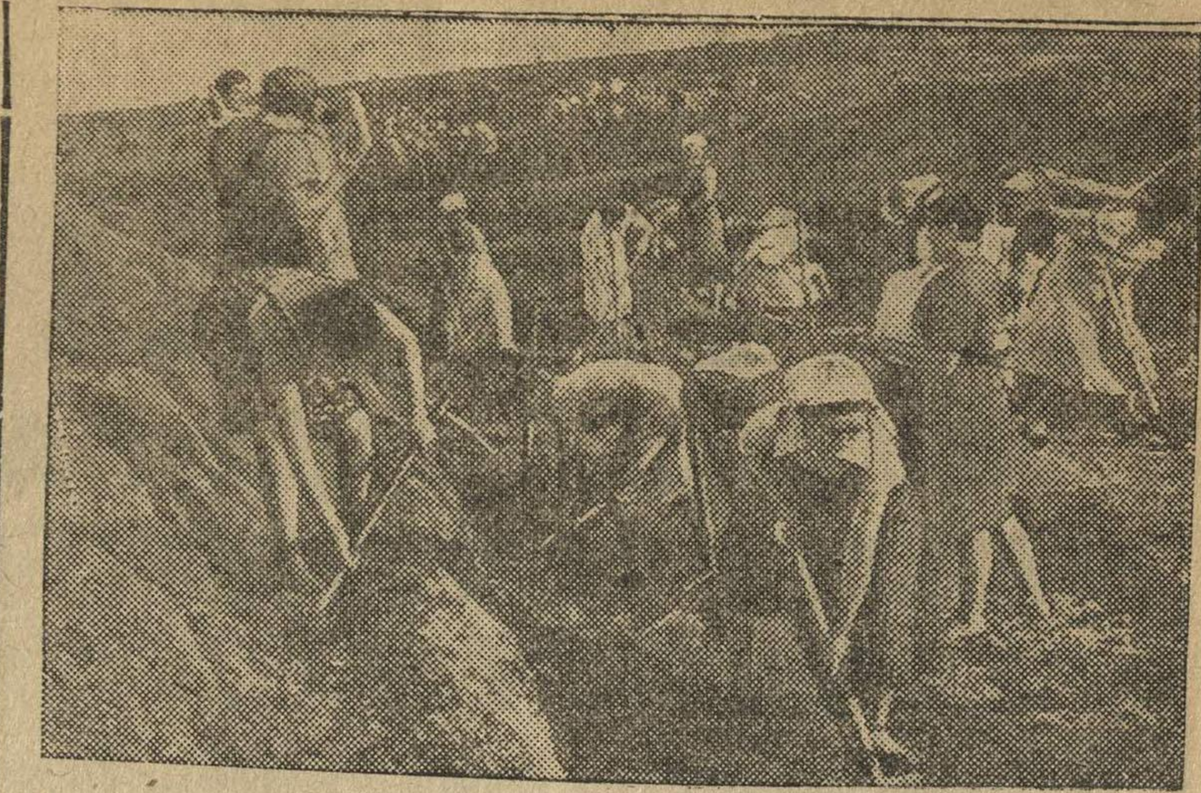
В прифронтовой полосе.