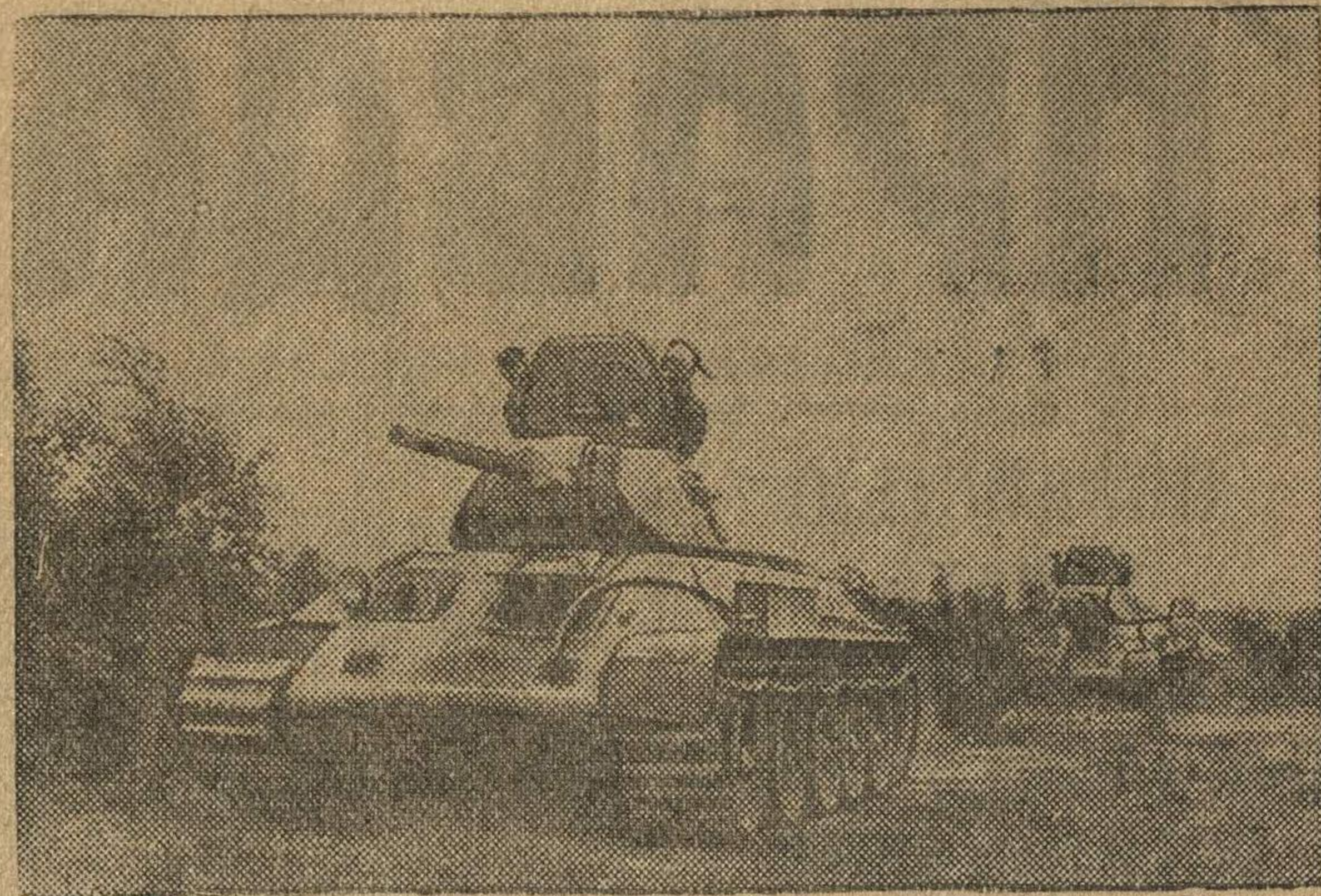
Танки выходят на выполнение боевого задания.