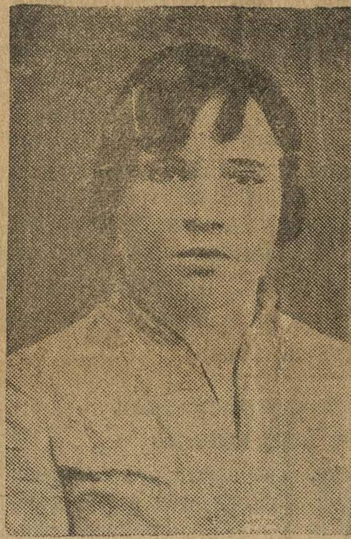
Знатная доярка колхоза „12 лет Октября“ г. Сереброва. За 11 месяцев нынешнего года она получила от каждой фуражной коровы 2425 литров молока, на 593 литра больше, чем было получено за 12 мес. в прошлом году

Агроном орденосного колхоза «Красный маяк».