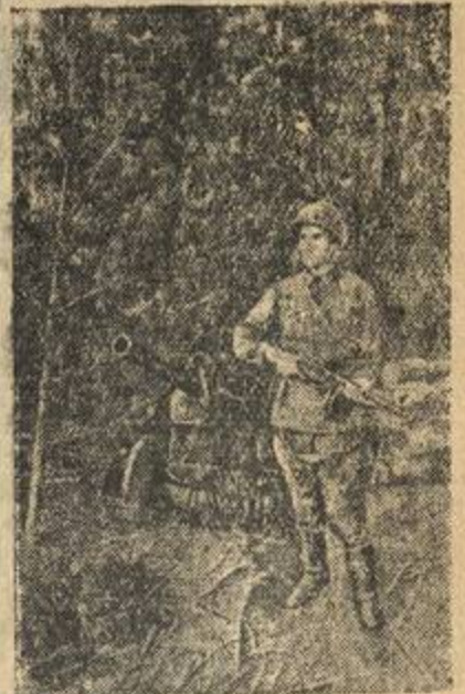
В Нской гвардейской краснознаменной стрелковой дивизии. На переднем крае оборонительного рубежа.