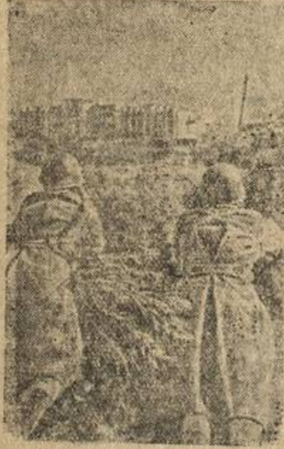
На снимке: Автоматчики обстреливают засевших в соседних кварталах немцев.