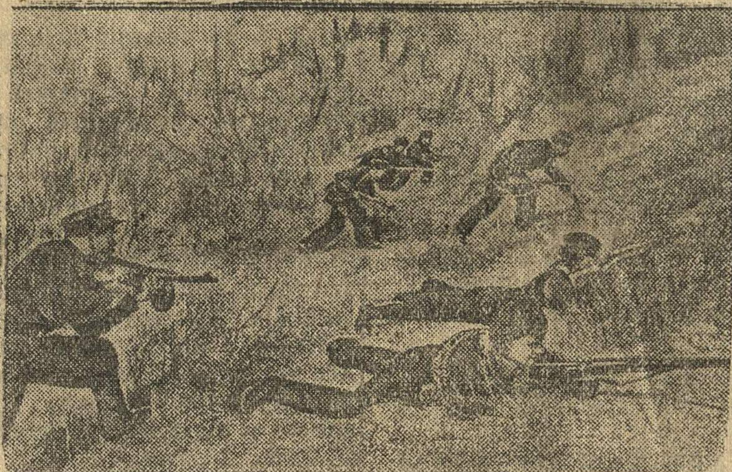
НА СНИМКЕ: Группа краснофлотцев-десантников в боевой операции на территории, занятой противником.

ДЕЙСТВУЮЩИЙ ЧЕРНОМОРСКИЙ ФЛОТ. (Крымский участок фронта).