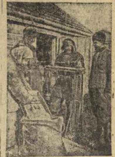
В колхозе „За мир и труд“ (Краснодарский край) снова заработала колхозная мельница. Обслуживая колхозников, она в то же время выполняет наряды частей Красной Армии по перемолу их зерна. На снимке: Представители воинской части принимают свою муку, смолотую на колхозной мельнице.