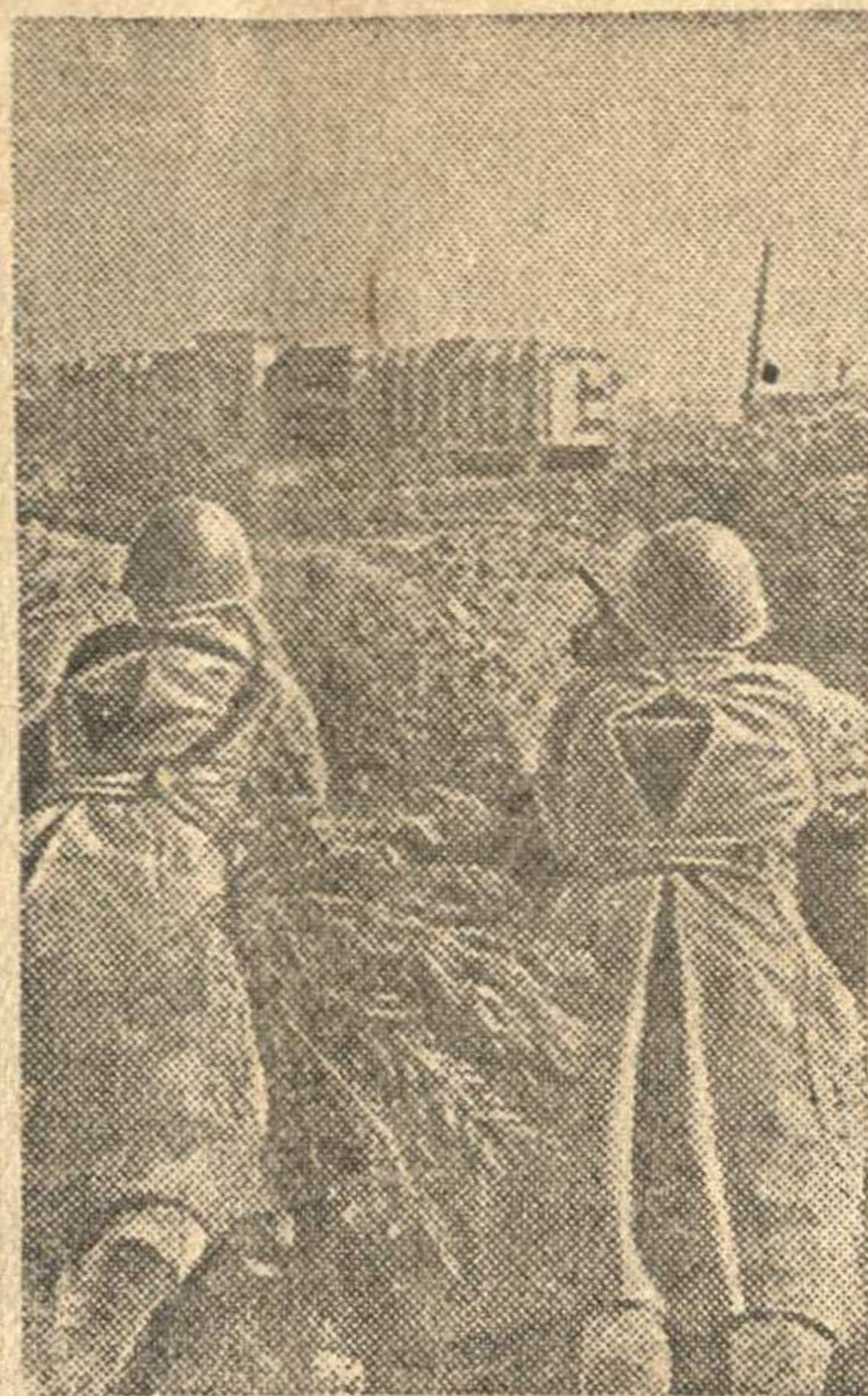
На снимке: уличные бои на окраинах города. Автоматчики обстреливают засевших в соседних кварталах немцев.