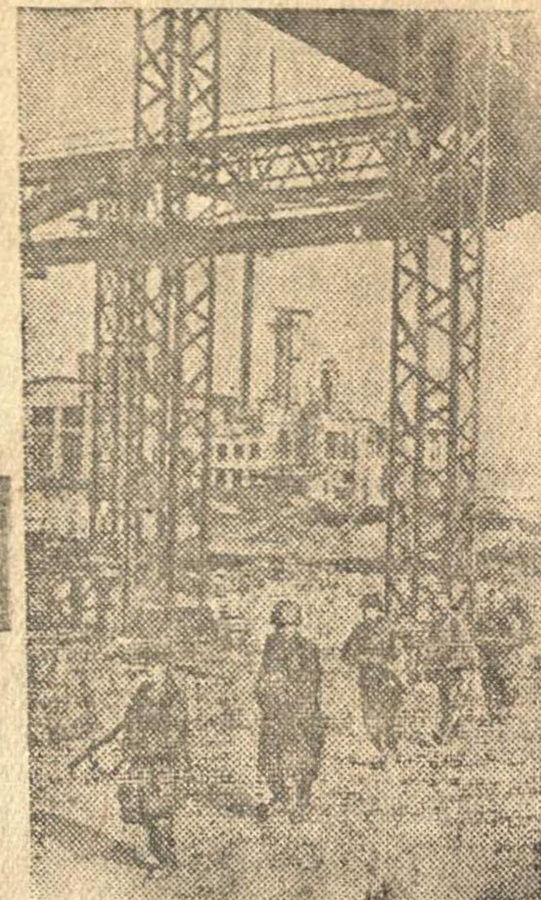
На снимке: отступающие бойцы в рабочем батальоне одного из заводов, защищающих родное предприятие.