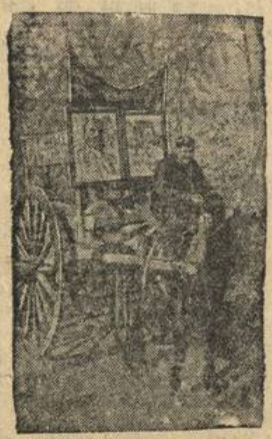
Колхозники Узбекистана отирают рабочим промышленных предприятий колесные ободы с продуктами из своих личных продовольственных запасов. На снимке: Колхозники сельхозартели имени Сталина (Ярмаракский сельсовет, Ферганский район) возят продукты рабочим.

(Передовая „Горьковской коммуны“ от 21 ноября)